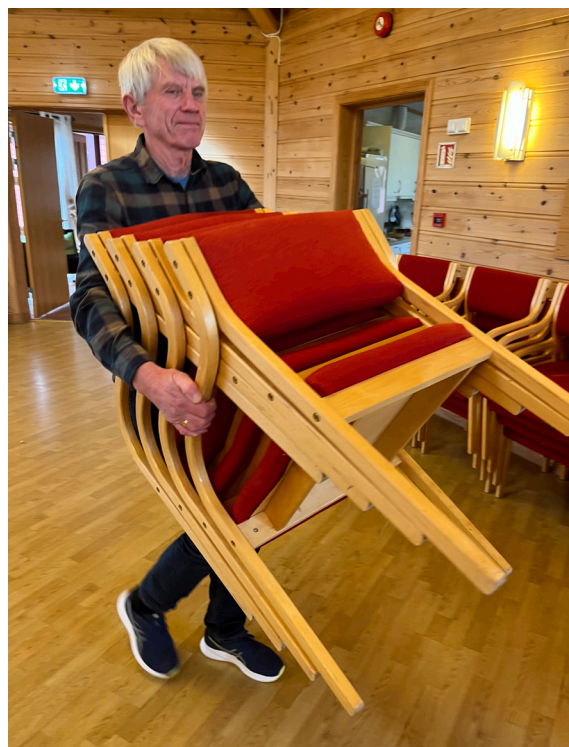
RYDDING: Det har blitt nokre stolløft på Kåre opp gjennom åra.

– Å bidra for andre, gir oss veldig mykje tilbake. Det trur eg mange andre også føler på. For oss er det fint å få vere med på å tilretteleggje for at flest mogeleg skal få gleda av å møte Jesus – og det gode i livet. Alle fortener å ha det bra. Absolutt alle!