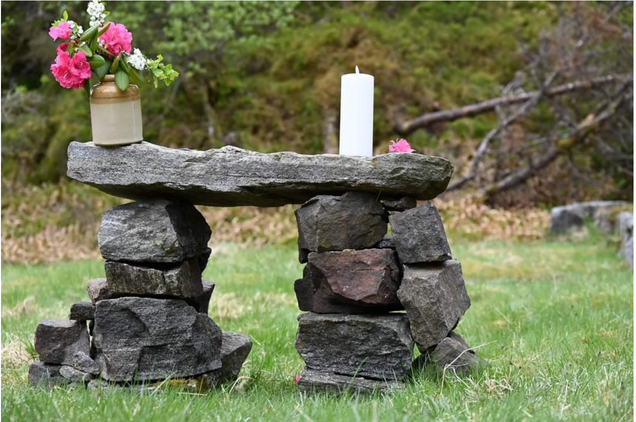
Altaret på Håøytoppen.

Tekst: Teksten er eit samarbeid mellom stab og diverse frivillige medarbeidarar.