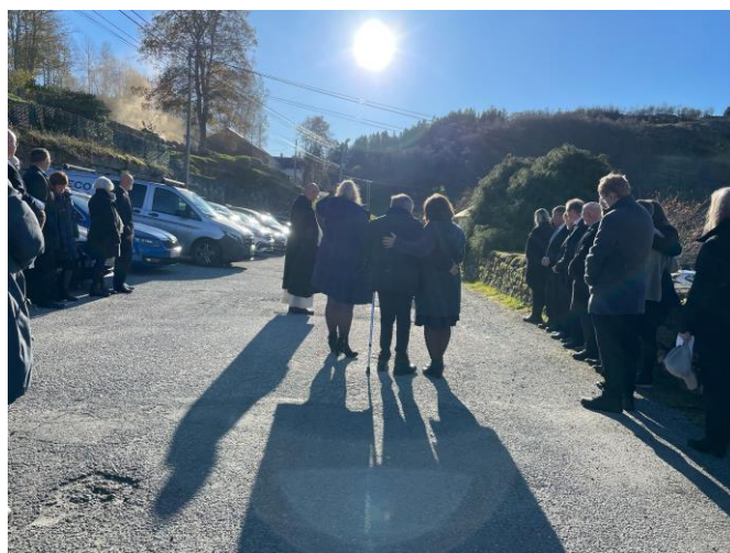
Gravferder og bisetjingar utgjer ein stor del av dei tilsette sitt arbeid. Her frå ei bisetjing.

Misjonsutvalet i Meland har som oppgåve å formidle informasjon om misjonsprosjektet til kyrkjelyden, og vere bindeledd mellom misjonsorganisasjonen og kyrkjelyden.