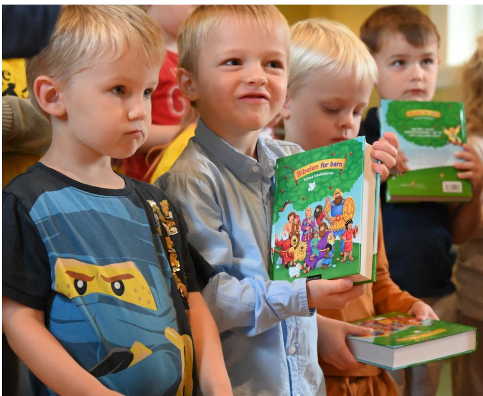
Utdeling av 4-årsbok

Her må det kanskje inn litt tekst for å skilje bilde frå overskrift