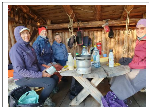
Ei husgruppe på tur med sommaravslutning

Det var 9 husgrupper i regi av kyrkjelyden i 2024. I tillegg var det fleire misjonsgrupper, turgruppa Ferdafolk og andre grupper i sving, som ikkje rapporterer til kyrkjelyden. Gruppene er viktige for fellesskap, både åndeleg og sosialt, og bygger kyrkjelyden