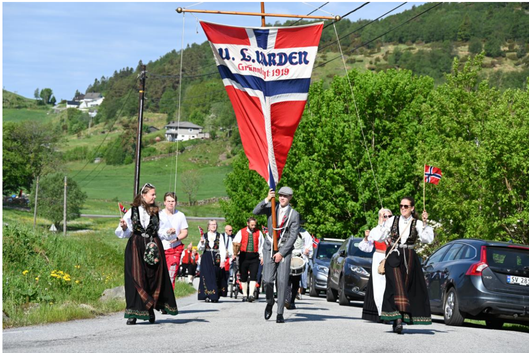
Eitt av to 17. mai-tog til Meland i 2024

Tekst: Teksten er eit samarbeid mellom stab og diverse frivillige medarbeidarar.