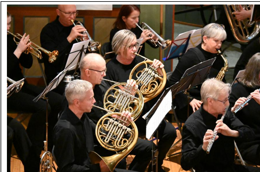
Meland musikklag 8.12

Av arrangement kan ein nemne dei to julekonsertane. Den 8. desember deltok lokale korps og solistar. 15. desember hadde koret Felix Vocalis eigen konsert.