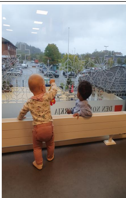
Dei minste finn seg til rette på Kyrkjetoget

Konfirmantåret starta med lysmesse første søndag i advent. Konfirmantane har deltatt i undervisningsgrupper, har vore på leir, konfirmantfestival og gudstenester. Det var to undervisningsgrupper på Rosslund og tre på Frekhaug, og begge prestane, diakonen og kyrkjelydspedagogen er alle med og underviser. Konfirmantarbeidet er det arbeidet vi bruker mest ressursar og tid på i trusopplæringsarbeidet. Det blei gjennomført 6 vanlige konfirmasjonsgudstenester, pluss to ekstra som var tilrettelagt for enkeltkonfirmantar.