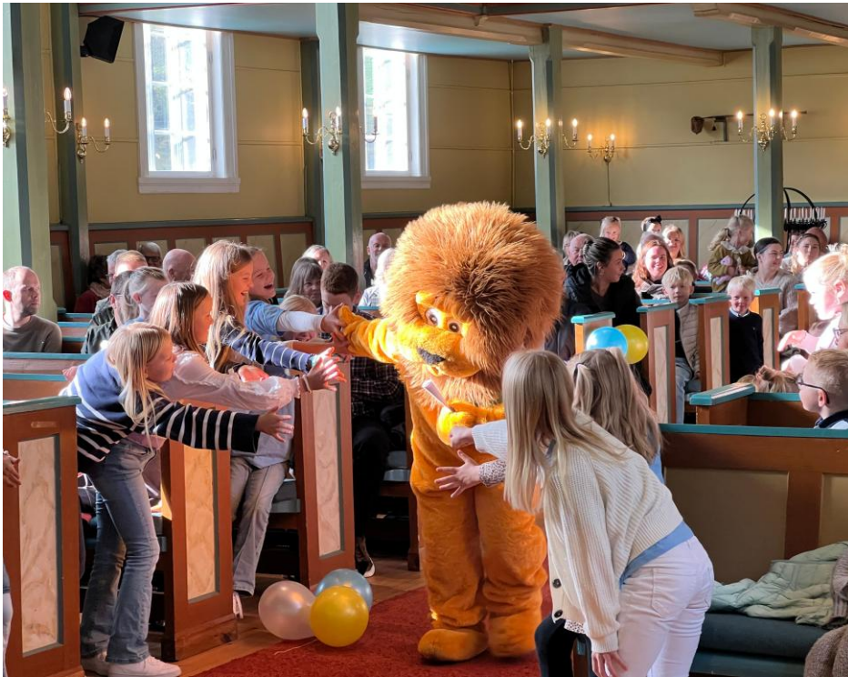
Løva er alltid velkommen, her på gudsteneste for 4-årsbok