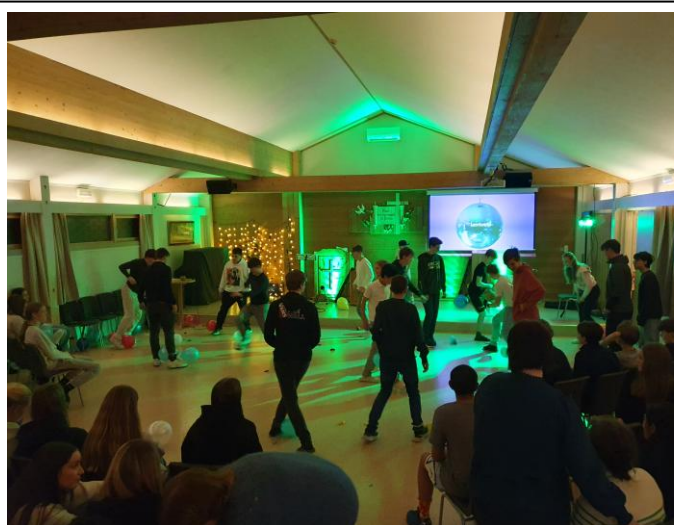
Leirkveld på konfirmantleiren; Fjell-Iy 2024

Også i år hadde vi nokre fine barnehagevandringar i starten på adventstida. Fire barnehagar kom på besøk, fordelt på to dagar. Dette er fine møtepunkt, både for barn og vaksne.