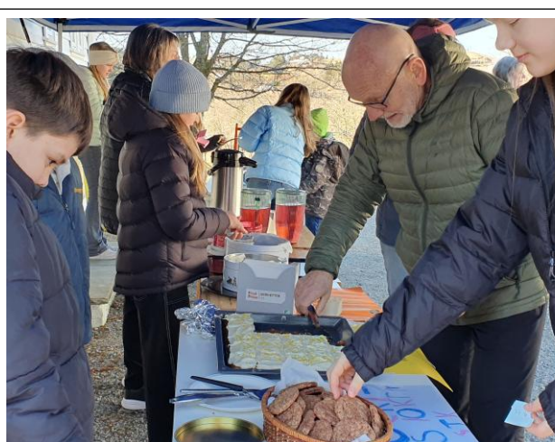
Marked for rettferdighet