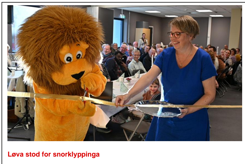
Løva stod for snorklyppinga

27.september avvikla soknet ein fin opningsfest på Kyrkjetoget med stappfullt hus og stor glede, uhøgtidleg men formell opning, pizza, korsong, opningsord, festtalar og basar.