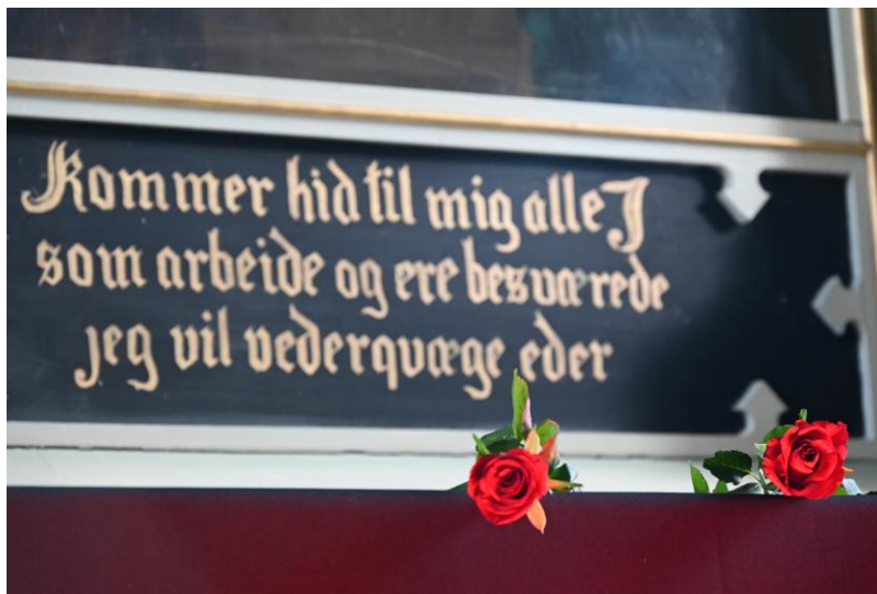
Alteret på Langfredag

Friluftsgudsteneste på Holmeknappen, medan gudstenesta på Håøytoppen blei flytta til Meland kyrkje grunna ufyseleg ver. Det var leirgudstenester, Søndagsåpent x 9, minnegudsteneste, Askeonsdagsgudsteneste og gudstenester på Nordgardstunet og Dagsenteret, det var totalt fire Løvegjenggudstenester, og gudstenester med Sprell Levande, Agent for rettferd, Tårnagent og Lys Vaken, nokre misjonsgudstenester, ei lysmesse, ei fasteaksjonsgudsteneste og ein