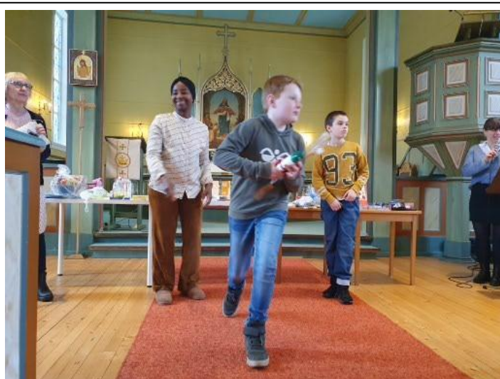
Basar for misjonen er engasjerande

Misjonsutvalet i Meland kyrkjelyd har som oppgåve å formidle informasjon om misjonsprosjektet til kyrkjelyden, og vere bindeledd mellom misjonsorganisasjonen og kyrkjelyden. For tida støttar Meland kyrkjelyd det kristne mediarbeidet, SAT-7, som er ein del av Det norske misjonsselskap (NMS) sitt arbeid.