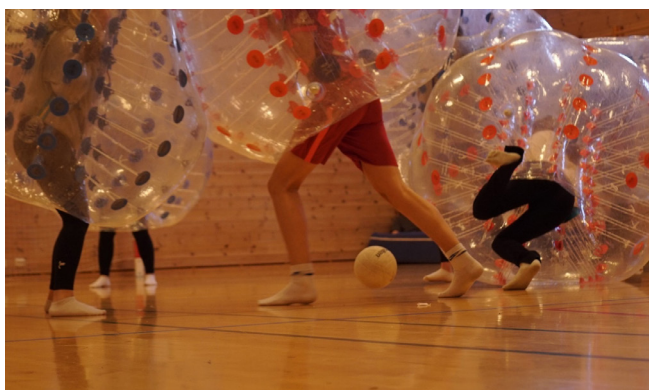
Boblefotball i gymsalen