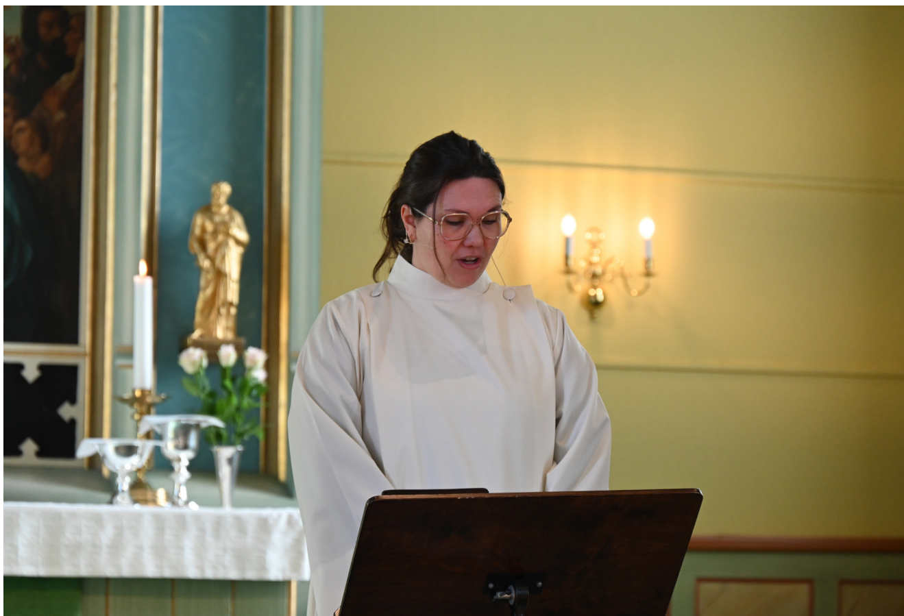
Det er kjekt å preike i Meland kyrkje