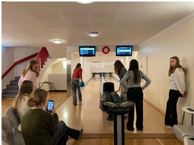
Ikkje alle leirstader kan skryte av at dei har bowlinghall!