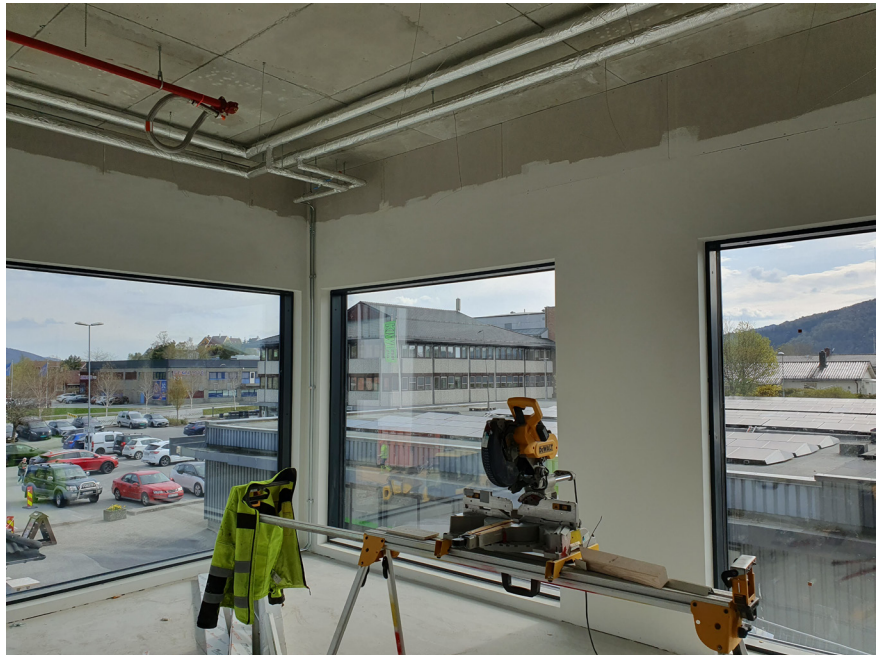
Hjørnekontoret med mykje lys og utsikt.

Sokneråd og stab har teke seg tid til å drøyme og tenkje på alle dei nye moglegheitene, men vil også lage konkrete planar etter kvart. Men i desse dagar er fokuset først og fremst å få lokala klare, så dei blir praktiske og fine for alle brukarar. Gjer deg klar til å kome og sjå ein gong i haust!!