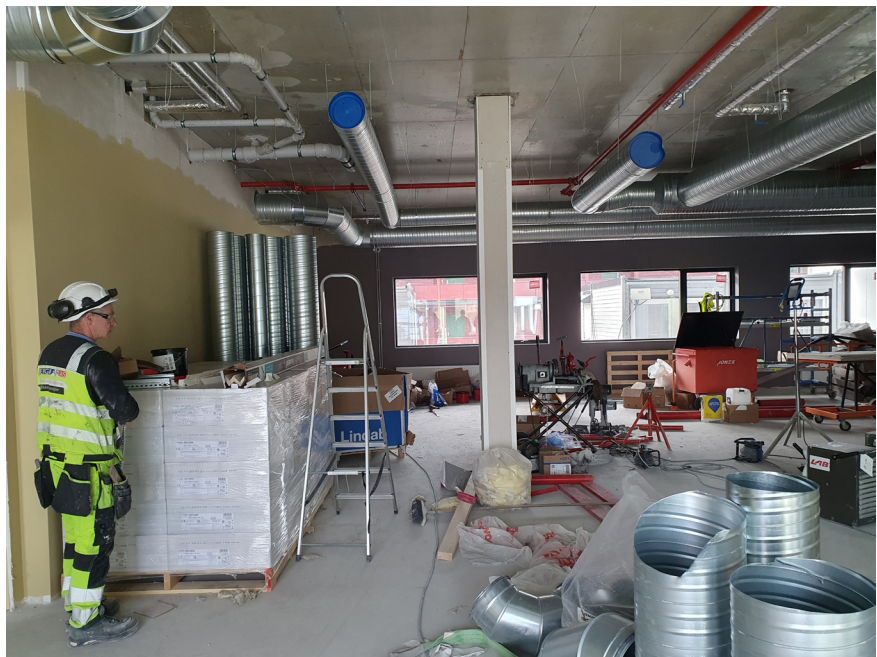
Arbeid pågår, og det er rotete no (april), men det skal bli fint!