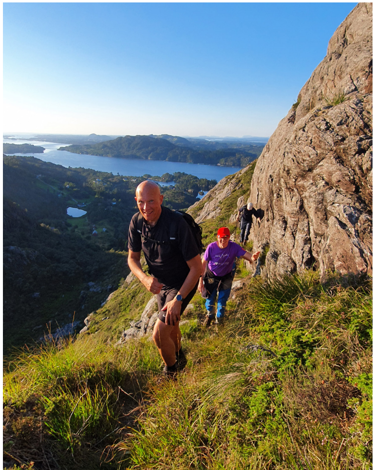
Pulsen skal opp

– Kanskje fleire mannfolk likar kombinasjonen av tur, kvardagsleg småpreik og djupare spørsmål? Det er i alle fall ein fin miks for oss, avsluttar dei to.