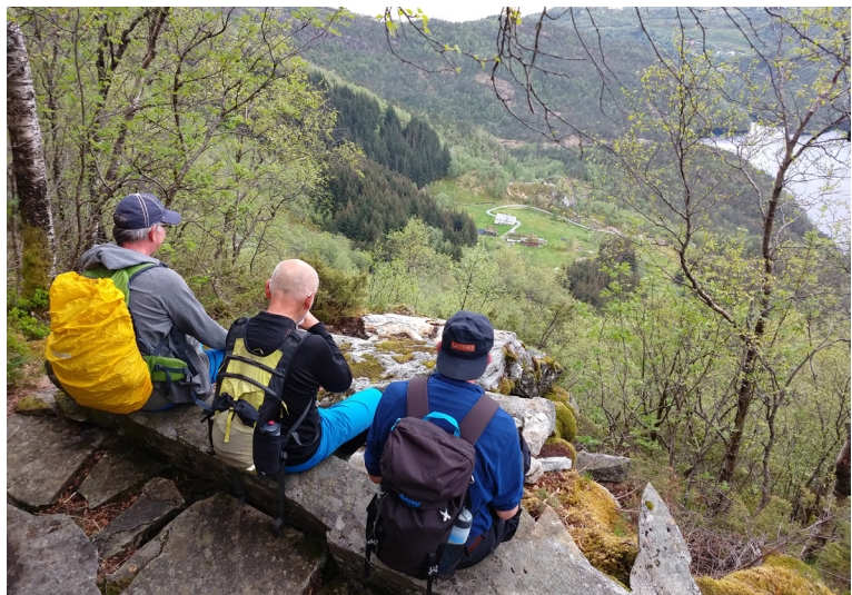
Den gode praten, på kanten av stupet.