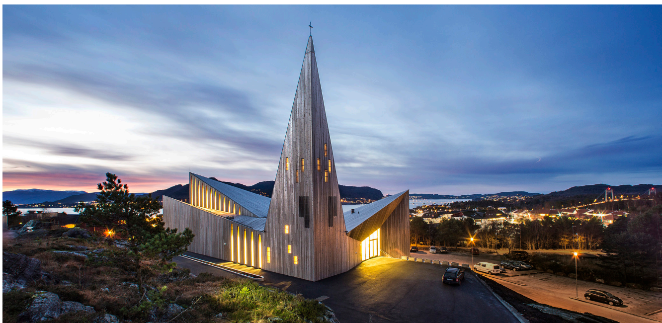
«-Som ei due som har funne sin stad»

Taranrød gler seg over at babysongen samlar mange små barn og foreldre. 2-3-åringane har kyrkjegym. Og når Knøttekoret møtast aular det med både barn og foreldre. Kyrkjeklubben er for menneske med psykiske utviklingshemming, og fredagsklubben samlar mange «twens». Bygdefolk og