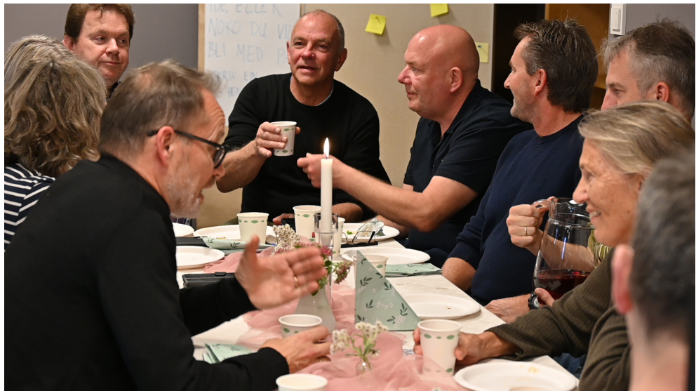
Fullt hus og god stemning