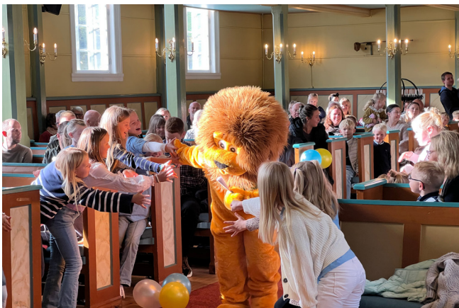
Løva er populær

29.september var det 4-årsbokutdeling i kyrkja. Dette blei ei veldig kjekk «sprell levande» gudsteneste! Mange barn var med, det var flott song av Levande Lys og forsongarar, og Løva var med å dele ut barnebiblar til 33 spente 4-åringar.