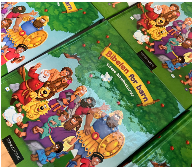
Barnebiblane som vert delt ut