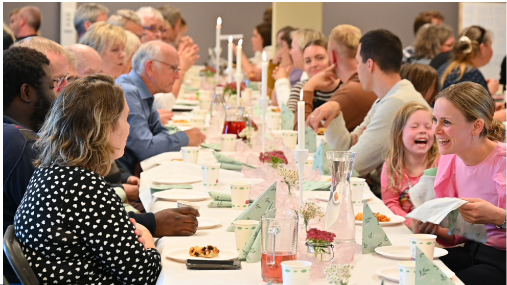
Fullt hus og god stemning

Fleire foto ligg på nettsida kyrkja.no/meland