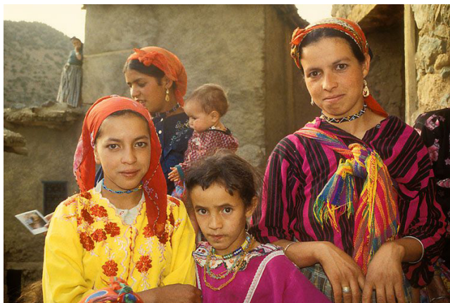
Amazigher (berbere) her fra Marokko.