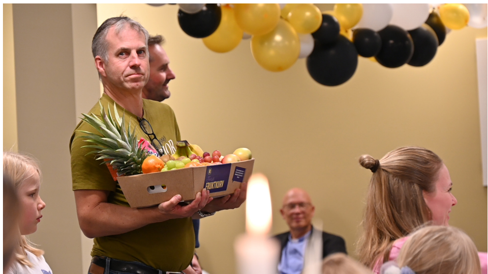
Utlodding og basarspenning.