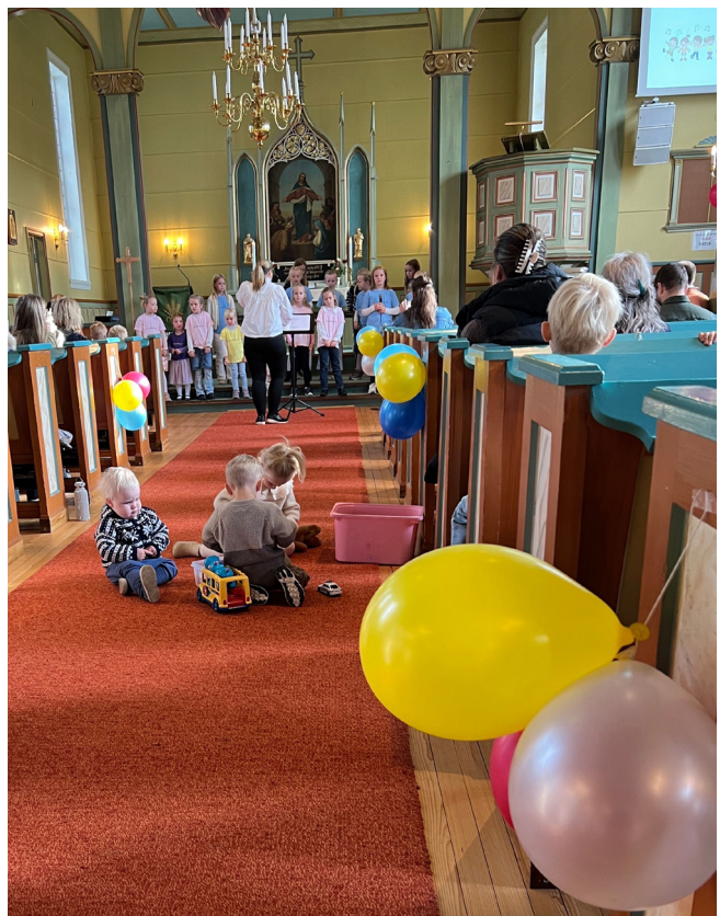
Barnekoret «Levande lys» syng medan dei minste held på med sitt.