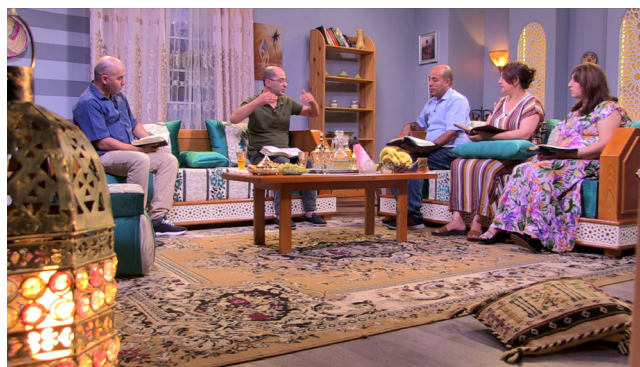
På settet for Home Church på SAT-7.

Alle programmene til SAT-7 i Algerie, inkludert Home