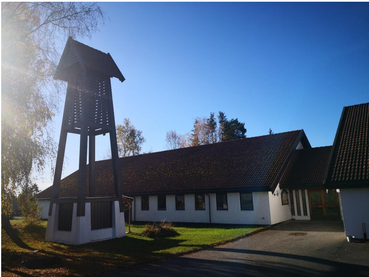
Ås arbeidskirke oktober 2020

Arbeidskirkens venner er trofaste givere, og spesielt i år er det av stor betydning at denne gruppen har fortsatt å bidra. Vi ønsker oss flere venner. Arbeidskirken har i år fått en svært stor anonym gave som har vært av stor betydning for oss. Tusen for alle gaver til arbeidskirken!