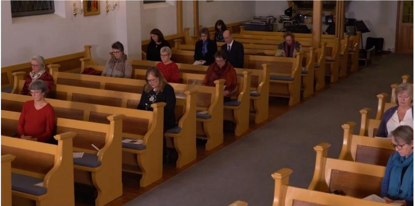
Innspilling av digital julaftensgudstjeneste med god avstand.

Koret driver en aktiv rekruttering. Koret er rimelig godt besatt på alle stemmer. Koret har motiverte og dyktige sangere!