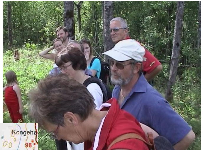
Historiefortelling, pic-nic og rebus-konkurransse på høyde 100