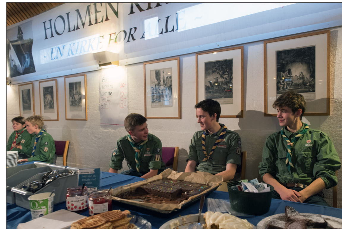
Speiderkaffe: dette er fra Førjuls messen hvor speiderne i Holmen har ansvaret for hele kafeen både lørdag og søndag. Speider og foreldre stiller opp og gjør en fantastisk jobb! Inntekten på førjuls messen går til menighetens arbeid og resultatet i 2017 ble 267.500 kr.