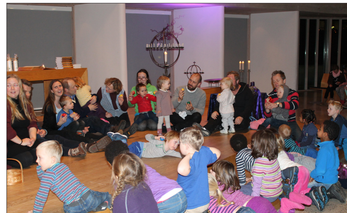
På myldredagene er det alltid fellessamling i kirkerommet kl. 17 før aktivitetene starter opp.