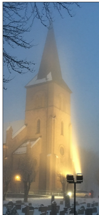
Asker kirke har fått ny lyssetting.

ringsgruppen drøfter pågående og framtidige prosjekter som kommune og kirke samarbeider om.