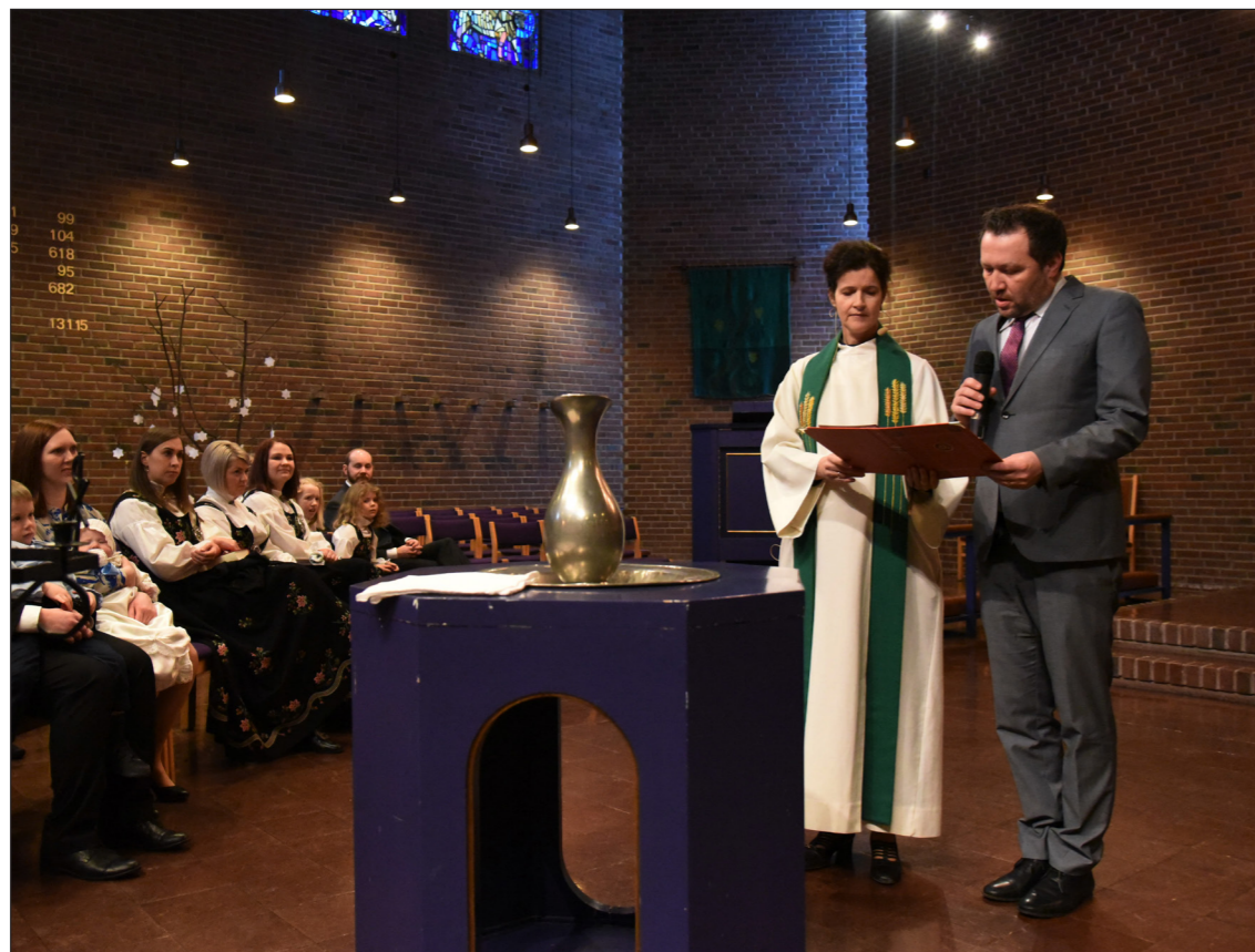
I Østenstad trekkes menigheten aktivt inn under gudstjenesten. Her leses dåpstekster av en fadder.

Ønsker du å vite mer om disse aktivitetene? Ring 66 79 99 60 eller send en epost: ostenstad.menighet.asker@kirken.no