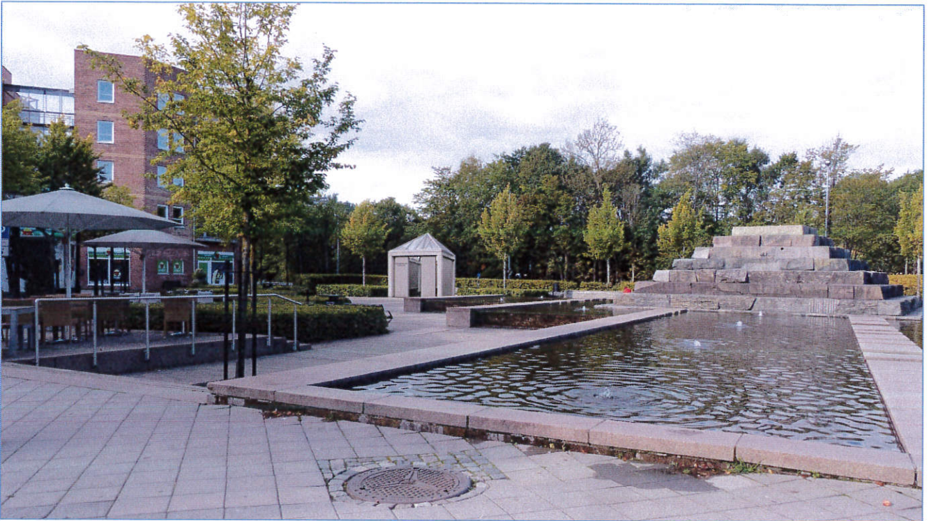
Fotomontasje av ny plassering for gatekapellet på Bakerløkka utenfor Asker kulturhus (III. Grønmo arkitekter)