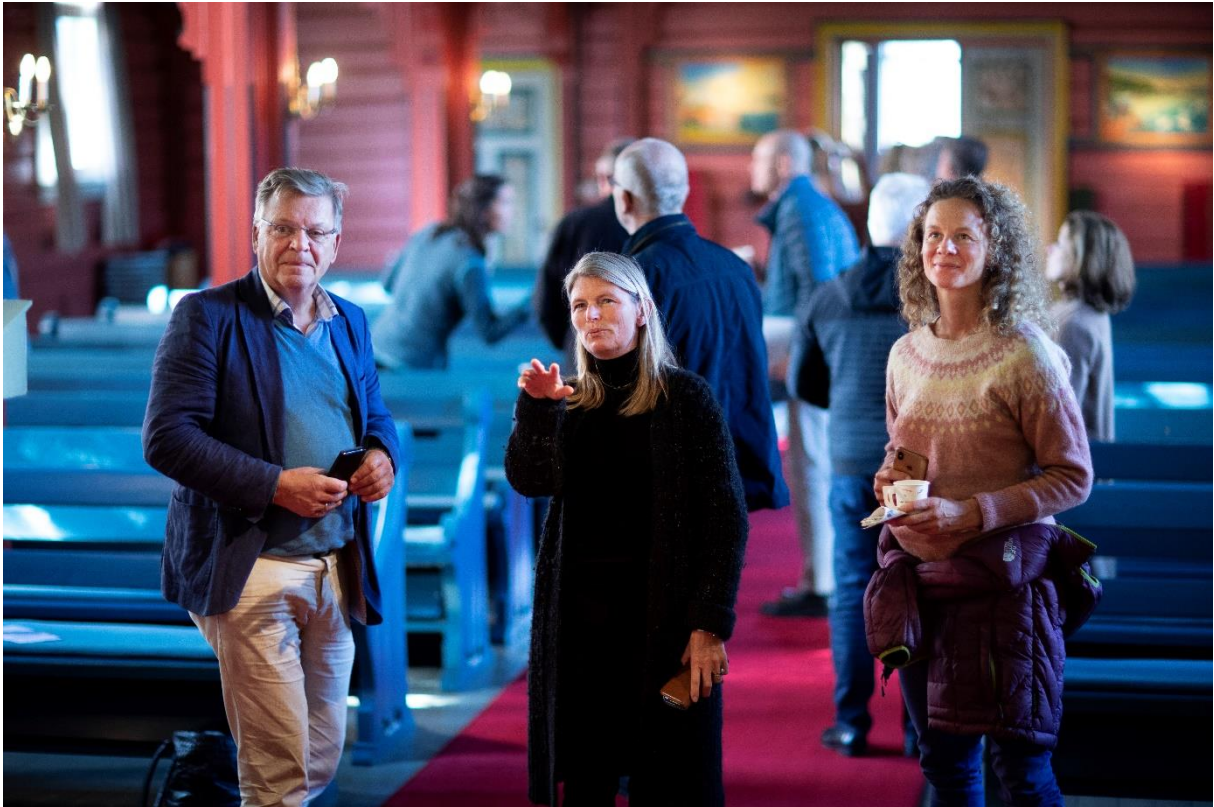
Formannskapet på befaring Kunsterkirken i Hurum 28. september. Formannskapet besøkte også Hurum middelderkirke og Røyken middelalderkirke.

Asker kirkelige fellesnemnd leverte i 2019 forslag til samarbeidsavtale med Asker kommune. Ny avtale er fortsatt ikke inngått, men samarbeidet fortsetter etter modell fra det gamle Asker.