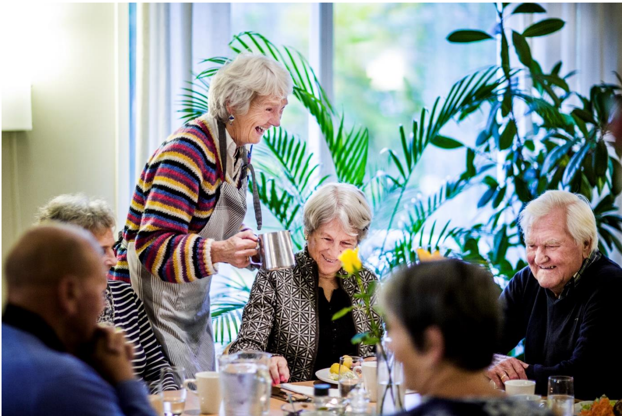
Torsdagsmiddag i Slemmestad kirkestue.

Frivillighet er viktig også for den frivillige. Frivillig arbeid er innrettet mot de som mottar innsatsen. Men som frivillig kan du også få tilbake opplevelsen av mening, sammenheng og fellesskap: Det er ved å gi at man får (Etter Frans av Assisi).