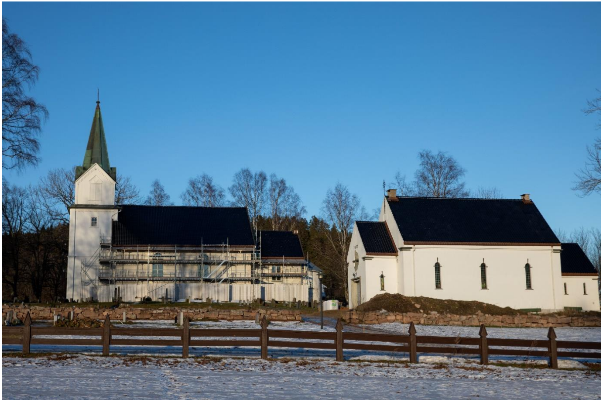
Hurum kirkested.