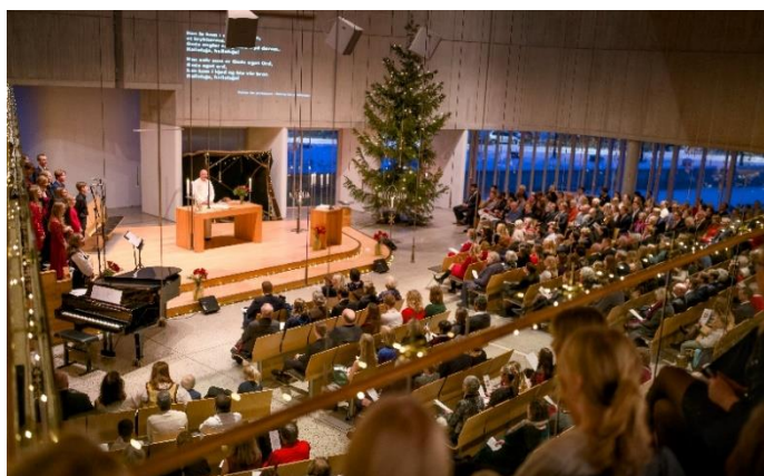
Foto: fullsatt julegudstjeneste i Vardåsen kirke