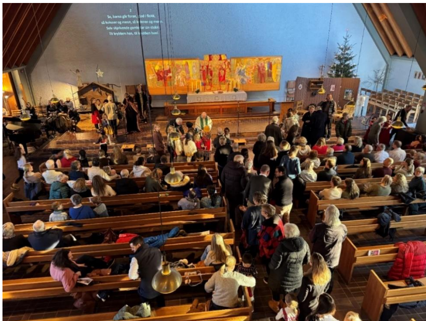
Holmen menighet har høy aktivitet og engasjement. Her fra familiegudstjeneste.

Året 2025 markerer altså at Holmen menighet har bestått i 60 år. En menighet som hele tiden har funnet nye veier; skapt gode møteplasser der forkynnelse, diakoni og omsorg går hånd i hånd med sang og musikk, misjon og tilbud til alle aldersgrupper. Holmen menighets visjon er å være et møtested for alle, være en raus og tydelig kirke hvor mennesker får hjelp til å leve livet i tro, håp og kjærlighet.