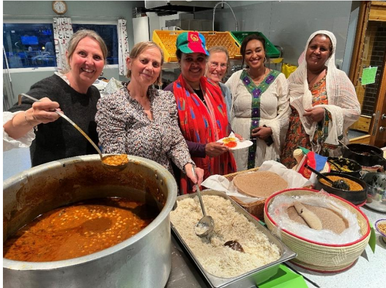
Internasjonal fest i Østenstad.

internasjonale familiefesten. Samarbeidsrådet for tros- og livssynssamfunn er en paraplyorganisasjon for tros- og livssynssamfunn og sammenslutninger av disse. STL samler bredden av tros- og livssynssamfunn til dialog og politisk arbeid for likebehandling.