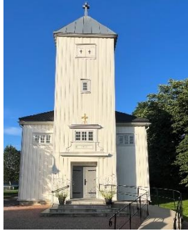
Slemmestad kirke