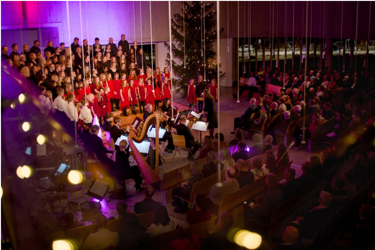
Over: Glimt fra julekonsert i Vardåsen kirke. Under: Kunstutstilling i Hurum kirkestue.