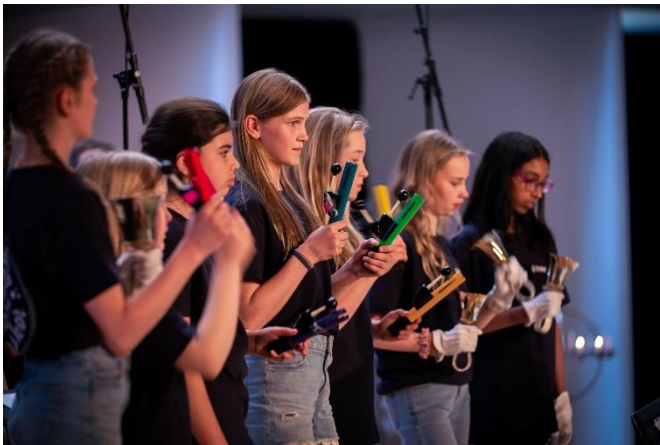
Øverst til venstre: Lys Våken i Vardåsen kirke.