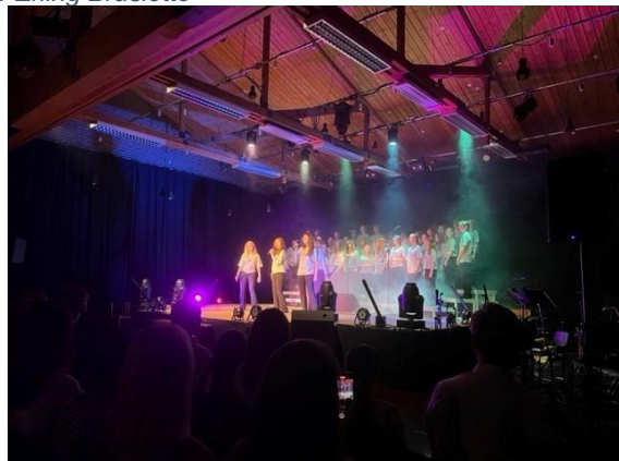
Venstre: I Holmen inviterte menigheten til Papa Panovs julefortelling. Høyre: Ten-Sing og Konfirmantmusikal i Østenstad kirke.