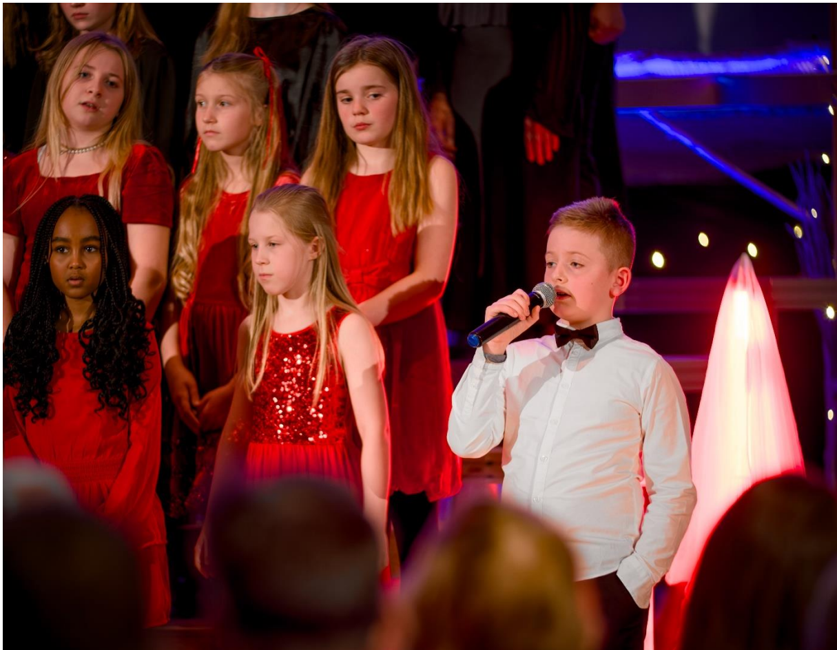
Vardåsen kirkes korskole er et svært populært tilbud, og må stadig utvide. Her fra julekonsert i 2024.

Menighetene i Asker driver kor- og kulturarbeid for barn og unge i hele kommunen. Det er blant annet tilbud om både babysang, barnekor og Ten-Sing. Korskolen i Vardåsen har grupper for aldre, og skaper konsertopplevelser sammen med menighetens voksenkor.