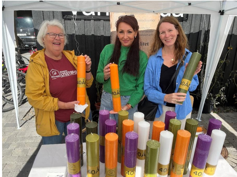
Lysstøperiet på salgsstand.

Heggedal Lysstøperi produserer og leverer lys av høy kvalitet til kirker, næringsliv og privatpersoner. Arbeiderne rekrutteres blant annet via Navs ulike avdelinger, som introduksjonsprogrammet for flyktninger, og fra Fontenehuset i Asker og Arba inkludering. Nye samarbeid har ført til flere nye lysstøpere som kan stå i arbeid over tid, til sammen 13 personer i 2024. De erfarer at dette er en god arbeidstreningarena, hvor målet er å komme videre ut i arbeid eller studier. På lysstøperiet er det krav til rusfrihet. I 2024 har vi hatt 4 frivillige som til sammen har utført 1 110 timer arbeid.