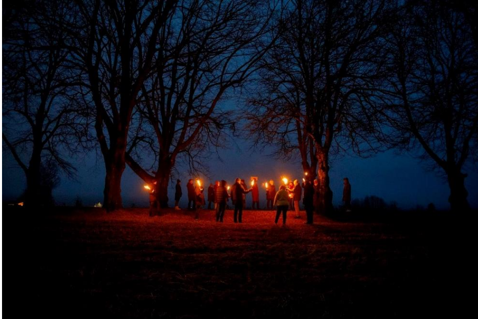
Fakkeltog og historisk vandring i nærområdet med Håvard Kilhavn under «Jul i Prestegårdsalleen» - felles arrangement med Hovtun og Nærmiljøsentralen.

Kommunen har i 2024 bidratt til å rehabilitere bygget og Venneforeningen Kulturhuset Hovtun har allerede hatt en rekke aktiviteter med stor deltakelse fra bygdefolket. Flere av disse arrangementene i samarbeid med Nordre Hurum sokn, middelalderkirken og kirkestua.