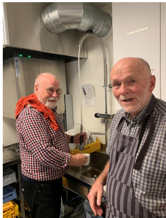
Menighetenes diakoner er frivillighetsledere som skaper mye aktivitet i lokalsamfunnet. Her er frivillige medarbeidere i sving på kjøkkenet under novembermarkedet i Asker menighet.

Menigheten som et sosialt møtested og fellesskapene knyttet til kirkene betyr mye for de som kommer dit. Telefonisk kontakt og annen oppfølging av enkeltmennesker er også viktig, i møte med utenforskap, isolasjon og spesielle utfordringer. Derfor er kirkens diakoni fortsatt et av kirkens viktigste avtrykk.