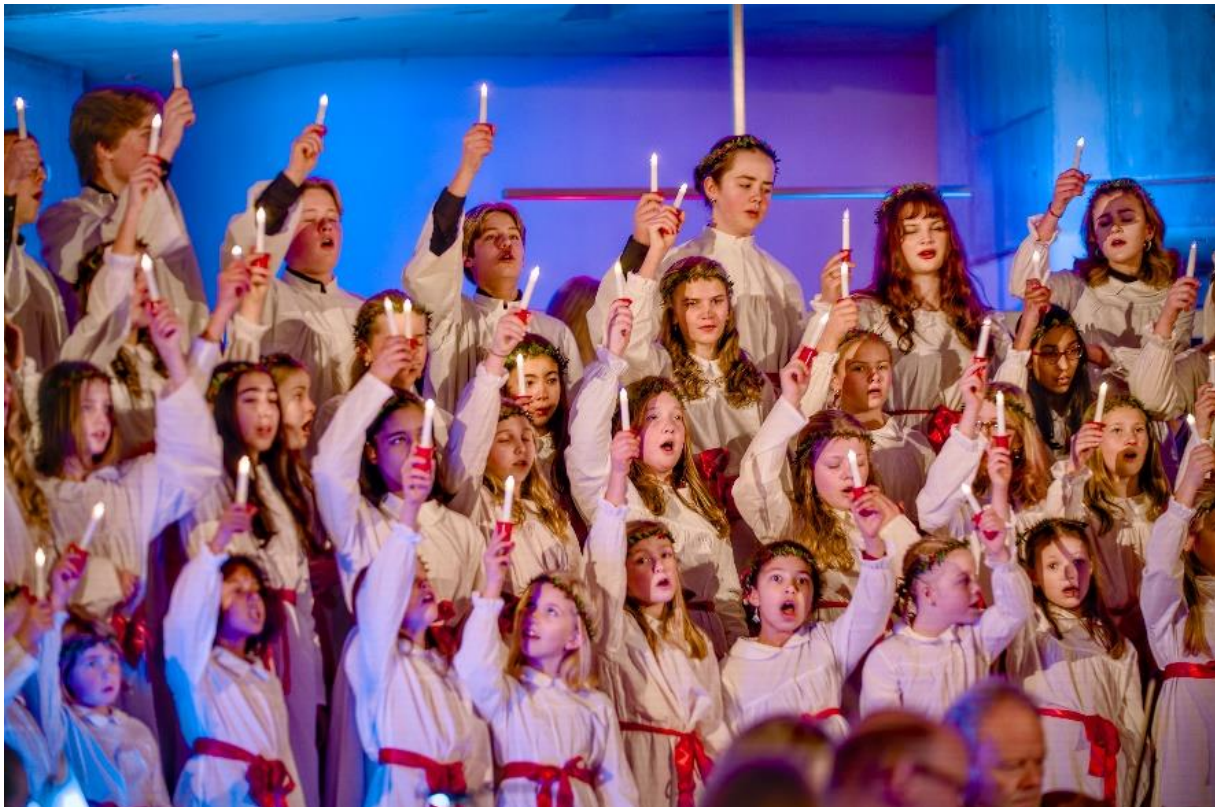
Julekonsert i Vardåsen kirke. Foto: Sven-Erling Brusletto

Forfatter Erika Flatland samlet et stort publikum på Y's Mens kulturkveld i Østenstad kirke (faksimile: Budstikka)