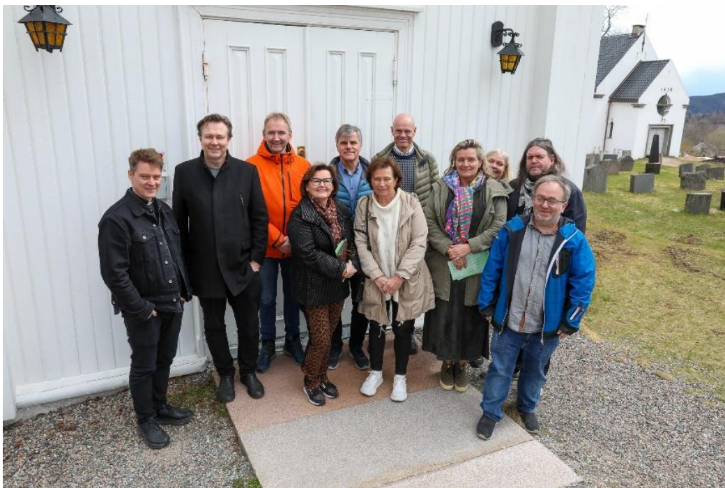
Kommunestyrepolitikere var i april på kirkesafari i Asker. Her utenfor middelalderkirken i Hurum.

Det er Utvalg for medborgerskap, virksomhetsområde Kulturliv som har ansvar for driftsbudsjett til kirkelig virksomhet, mens Utvalg for samfunnstjenester har ansvar for samarbeid om bygg, anlegg og investeringer. I tillegg til kommunale tilskudd mottar fellesrådet støtte fra staten til trosopplæring. Dette bidrar samlet til utstrakt aktivitet og engasjement for enkeltmennesker og miljøer i hele kommunen. Kommunen støtter også andre livssyns- og trossamfunn med tilsvarende beløp.