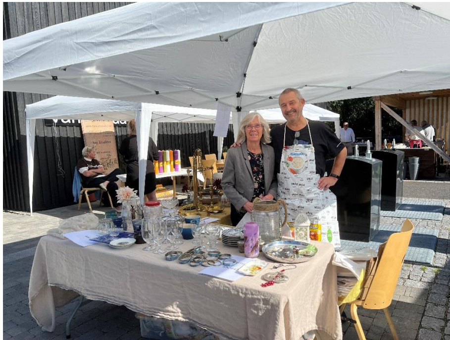
Det ble en flott markering av Kirkens feltarbeids 40 år, med underholdning innendørs og både servering og egen salgsbod fra bruktbuikken Bra Brukt utendørs.

Ordføreren pekte på det viktige fellesskapet i feltarbeidet som gir mange mennesker i Asker et bedre liv, og som bidrar i kampen mot utenforskap. Hun berømmet også feltarbeidets evne til å tilpasse seg samfunnsutviklingen og bidra til å møte nye utfordringer i Askersamfunnet: