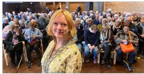
250 interesserte møtte opp på Østenstad Y's Mens kulturkveld for å høre forfatteren Erika Fatlands beretning om sin lange reise og sine eventyrlige opplevelser på ferden langs Russlands yttergrense.

Her er noen lokale bilder fra kulturarrangementer i menighetene.