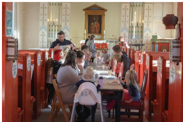
Menighetene i Asker tilbyr fellesskap rundt hverdagsmiddag flere steder, med solid innsats fra frivillige. Her er det dekket til Kirkemiddag i midtgangen i Kongsdelene kirke.

Den kirkelige frivilligheten i Asker er en betydelig ressurs, både for menighetene, kirkelig virksomhet og for hele Askersamfunnet. Menighetene i Asker har 996 registrerte frivillige, som bidrar til å skape omfattende aktivitet. En kartlegging i 2021 viste at frivillige la ned 64 200 timer i Asker-menighetene. Det tilsvarer 36,6 årsverk.