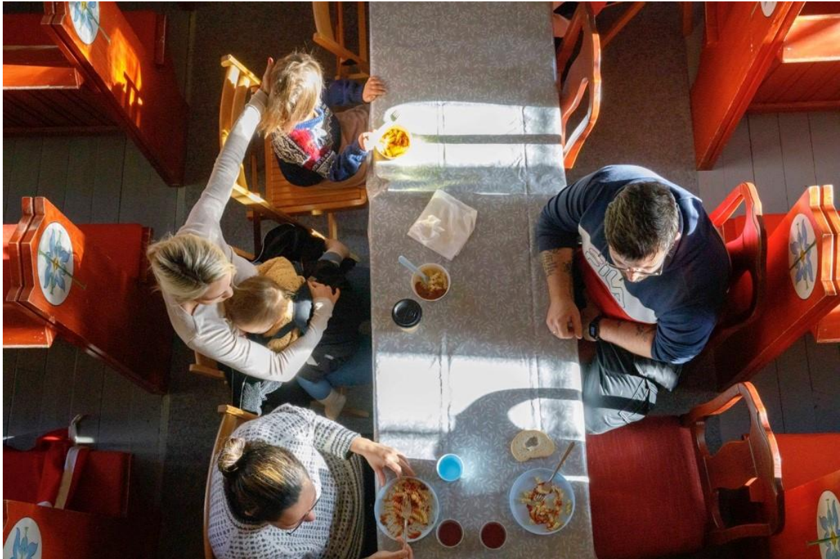
Velkommen! Kirkemiddag i Kongsdelene kirke i Sætre samler små og store til langbord i midtgangen.