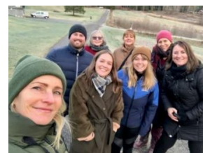
Endelig kunne vi samles til stabstur, Sørmarka, i nov.