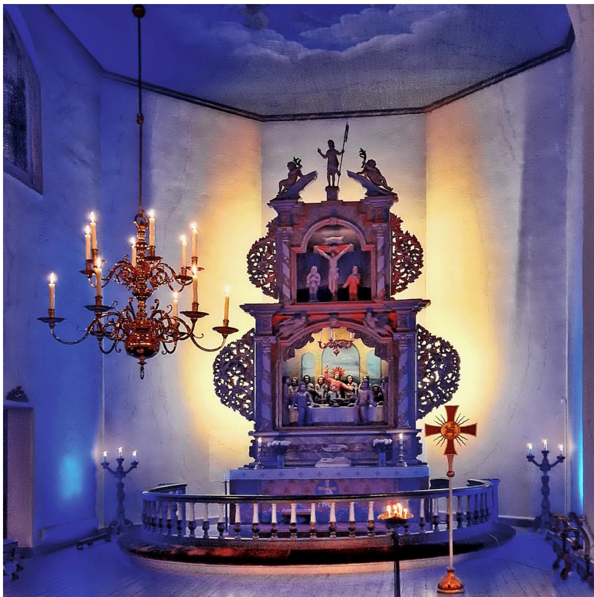
Fra kveldsmesse i Asker kirke