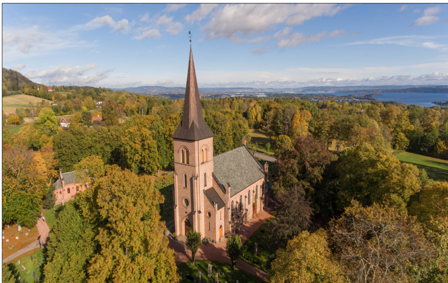
Asker kirke med fjorden i det fjerne.

Trenger du kirkeskyss? Ring tlf. 911 53 563 søndag før kl. 09.30.