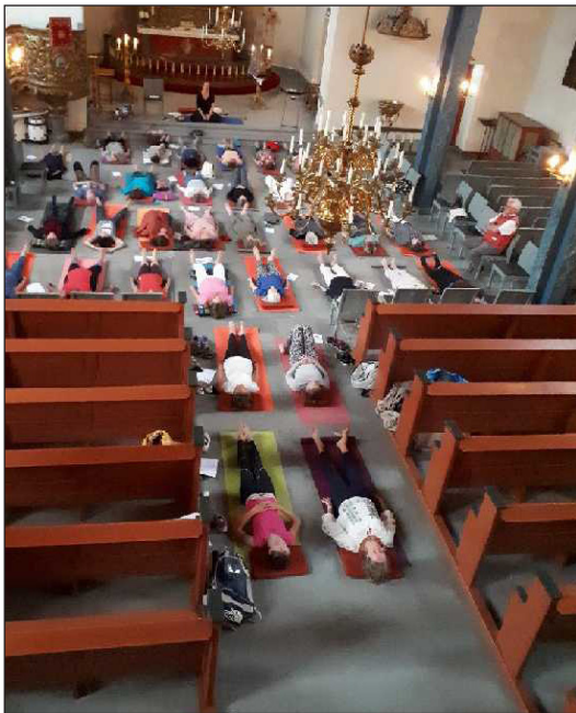
En annerledes bruk av kirken på kveldstid 2. pinsedag.

Jeg vet at noen ble nysgjerrige. Jeg vet at noen ble overrasket. Jeg vet at noen ble glade for et slikt tilbud.