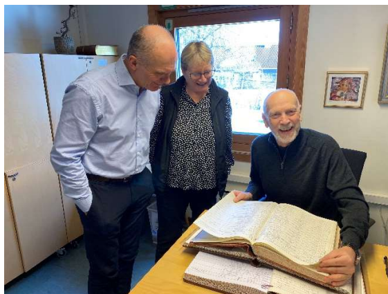
Gjennomgang av kirkebøkene.