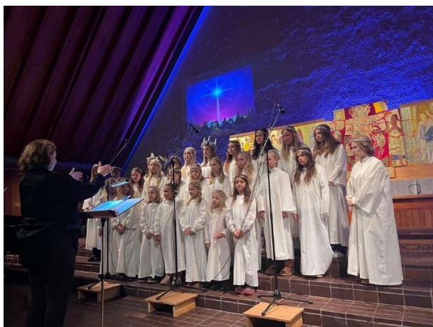
Vinterens vakreste oppvåkning. Tradisjonen tro vekker barnekorene menigheten med vakker jule- og vintermusikk på Luciamorgenen 13. desember. Etterpå serveres lussekatter og kaffe/soft. En nydelig start på dagen!

Turen kunne realiseres fordi vi fikk en generøs jubileumsgave av Holmen Y's Men, og fordi vi hadde spart opp litt selv ved å gjøre honorerte «pop up konserter» i regi av Asker kommune foruten billettinntekter fra Lucia-konserten og Panov-forestillingen samt kollekter i gudstjenesten. Korene har også sunget på julegrantenning i nabolaget og fått honorar for dette.