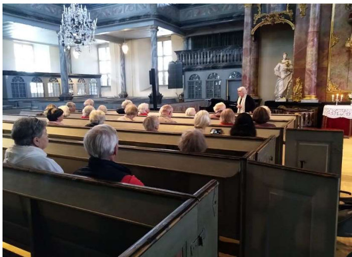
Fra besøk i Kongsberg kirke.