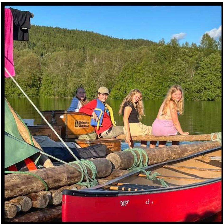
Fra flåteleiren 2023.