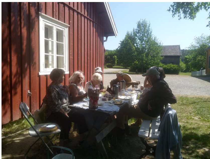
Fra diskonitur til Prøysenstua, august 2023.

Vi arbeider for fellesskapsbyggende og inkluderende aktiviteter med ønske om å møte alle mennesker i nestekjærlighetens ånd. Vi søker å bistå enkeltmennesker og gruppers behov i lokalsamfunnet. Vi har et forebyggende blikk, og gjennom aktiviteter og livslang læring er vi bidragsyter for trivsel og helse. Vi gir omsorg når sårbarhet, sykdom, utenforskap og nød rammer, men er også til stede ved livets fest og merkedager. Diakonien bønnetjeneste er aktiv hele året. Diakonien møter sjelelige behov gjennom sjelesorgsamtaler og forbønn. Vi arbeider for å ta vare på miljøet og jorda vår, og har regelmessig fokus på misjonsarbeidet og rettferdig fordeling av ressursene.