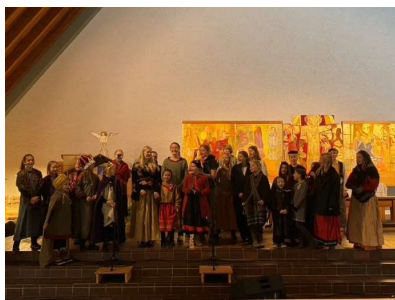
Papa Panovs Juledag, januar 2023

I pinsehelga fikk barnekorene endelig den lille turneen til Kragerø som opprinnelig skulle finne sted i 2020. Vi reiste med buss, hvor det var fantastisk stemning, med sang heeele veien nedover til Kragerø. Der hadde vi to overnattinger på Kragerø Sportell hvor vi også fikk alle måltidene. Vi sang vår egen formiddagskonsert i Kragerø kirke på pinseaften, og deltok også på pinsegudstjenesten i kirken søndag. Det ble også tid til quiz-kveld, bading, båttur og shopping. En etterlengtet turné som knyttet nye vennskapsbånd som er så viktig for miljøet i korene. Fire foreldre ble med som voksenledere og sørget for at alt gikk etter planen. Og Kragerø kirke ønsket oss hjertelig velkommen tilbake!