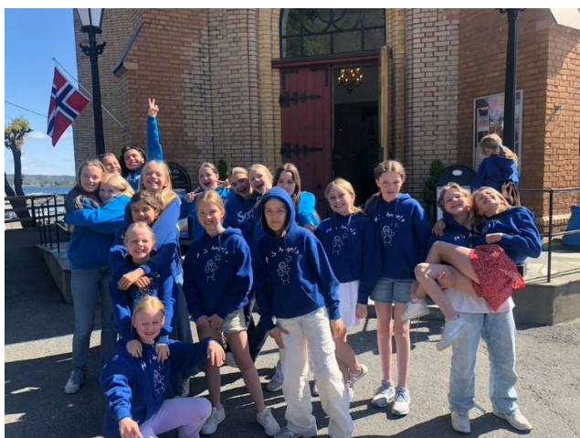
Utenfor Kragerø kirke 1. pinsedag 2023