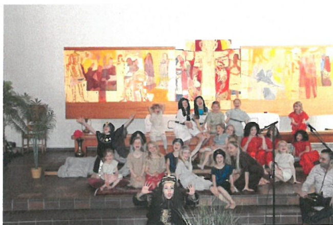
TROSOPPLÆRING 0-12 ÅR

2019 vært 4 musikaler som det er nedlagt et formidabelt arbeide med. Barna undervises gjennom hele året og fremfører musikalene i forbindelse med jule- og påskearrangementer.