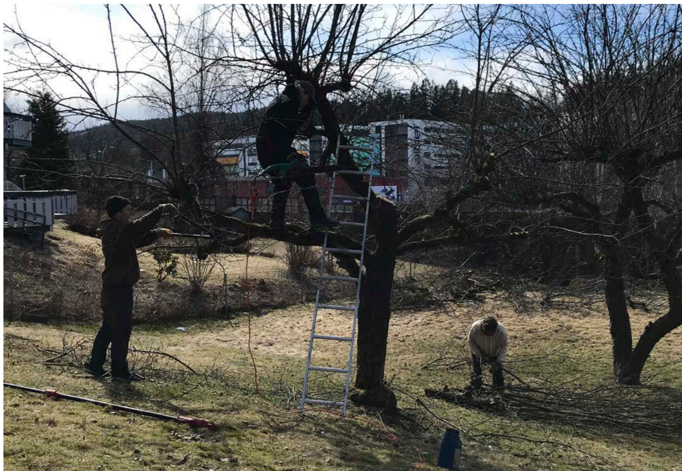
Arbeidstiltaket er et sysselsettingstiltak for rusavhengige, både kvinner og menn. Arbeidstiltaket påtar seg jobber for kunder i Asker og omegn.