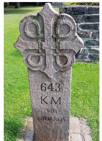
Steinen med 643 km til Nidaros.