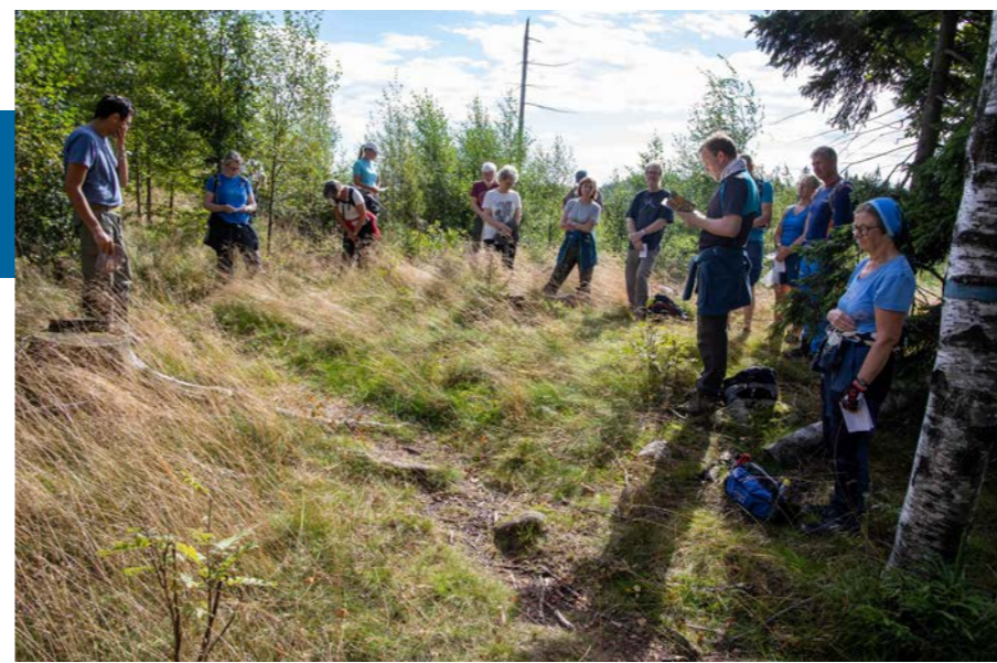
Fra fjorårets pilegrimsvandring