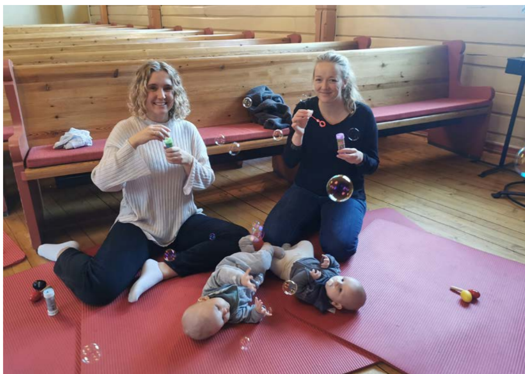
Fra babysang i Filtvet kirke

foreldre og baby. Kurset går over åtte ganger: onsdagene 2., 9., 16., 23., 30. mars, og 13., 20., 27. april kl 11.30-13.30.