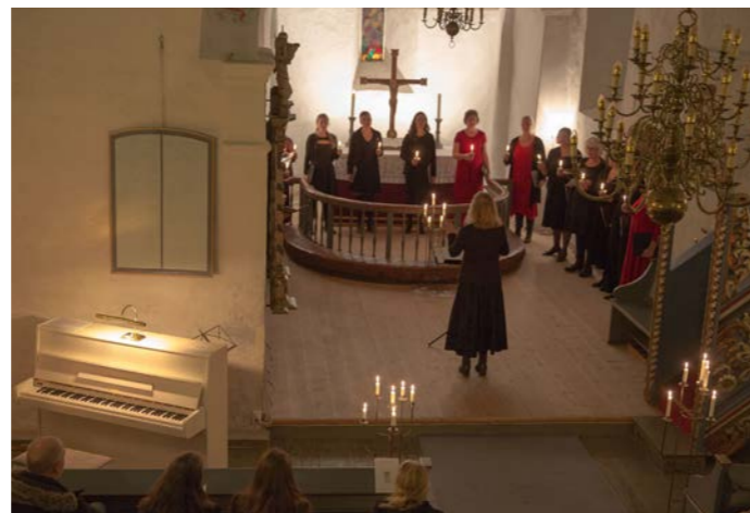
Julekonsert i Hurum kirke 4. desember med blant annet Coro Angelico

Familieforestilling som passer best for barn mellom 3 og 7 år. Påmelding til epost: