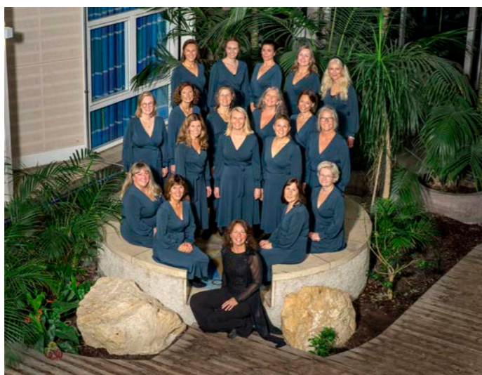
Sætre vokalforum har to konserter i Hurum kirke lille julaften

Adventskonsert med Sætre barnekor og musikere