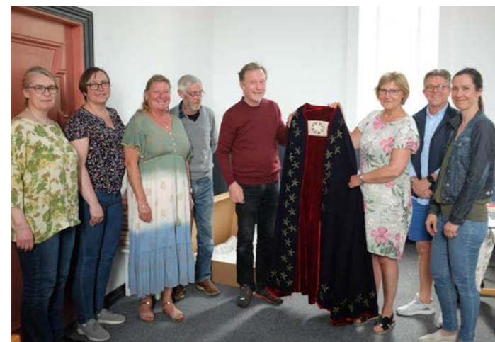
Menighetsrådet i Nordre Hurum viser fram den flotte Maria-kåpen.

Forslaget ble lagt frem for menighetsrådet, som umiddelbart ble begeistret. Nordre Hurum menighetsråd vedtok et ja til å anskaffe Maria-kåpen og til å søke Marie Andresens legat om støtte til finansieringen. Søkn-