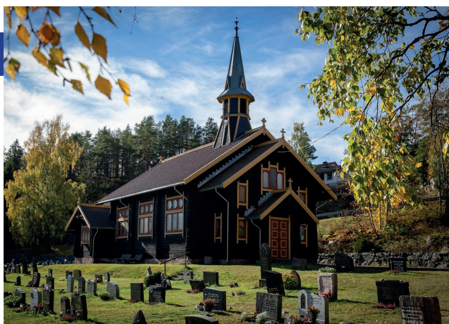
Filtvet kirke blir ofte kalt dugnadskirken fordi venneforening og frivillige har lagt ned og fortsatt legger ned en stor innsats for å holde kirken i god stand.

I tråd med fellesrådets prosjektprogram for Holmsbu kirke er det i 2023 gjennomført: