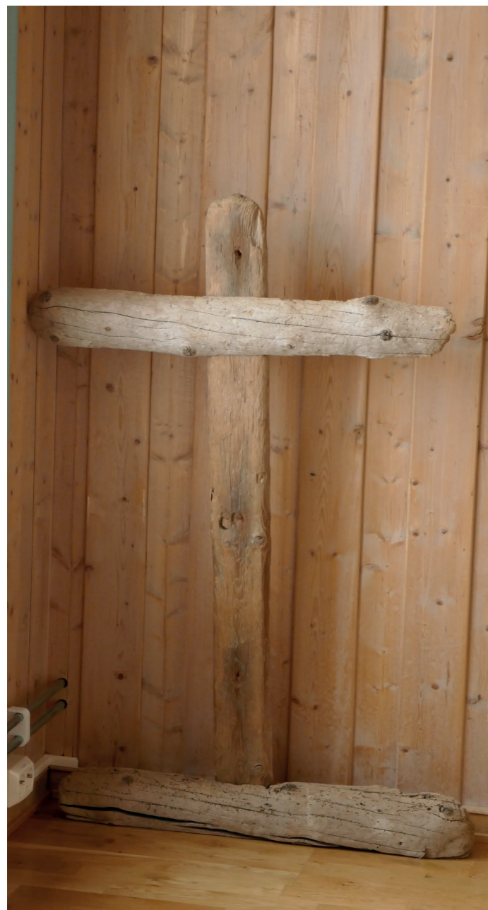
Kirkens prosesjonskors er laget av drivved.

I skyggen av platåfjellet, med utsikt over Adventfjorden og hele Longyearbyen ligger Svalbard kirke. En kirke som stolt kaller seg verdens nordligste kirke, en kirke med dører som er åpne 24/7.