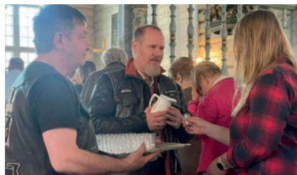
Fra en av våre gudstjenester