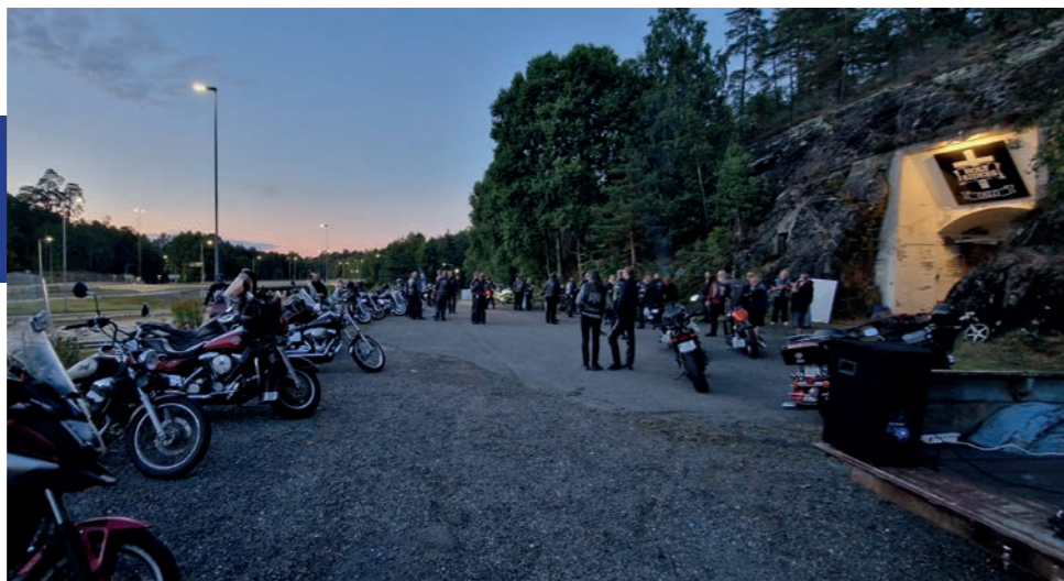
Utenfor lokalene - et gammelt tilfluktsrom uten adresse