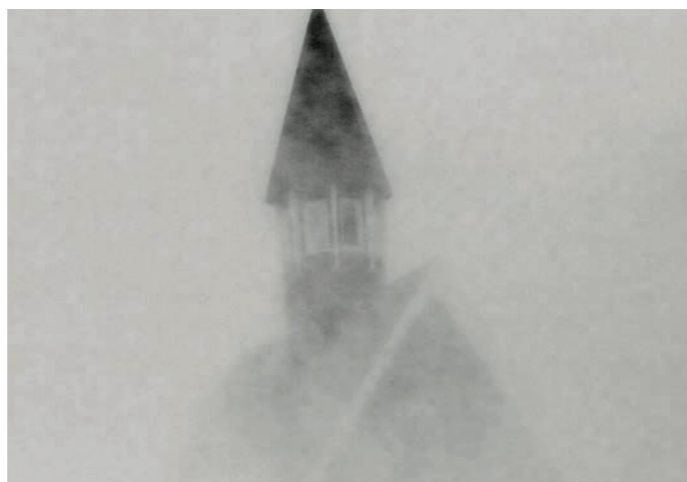
Svalbard kirke har forstått å gjøre døren høy og porten vid. Jeg klarer ikke å se for meg en mer inkluderende menighet, og håper andre kirker kan la seg inspirere.