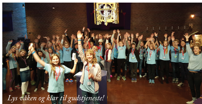
Lys våken og klar til gudstjeneste!

Meningen var at barn og unge ledere skulle sove i kirken fra lørdag til søndag, men som navnet på helgen antyder, ble det kanskje mest våkentid. Da søndagen opprant, var barna imidlertid klare til å delta i en «Lys våken» gudstjeneste med drama, sang og dans til glede for både dåpsfølge og de mange fremmøtte som fylte kirken 2. søndag i advent.