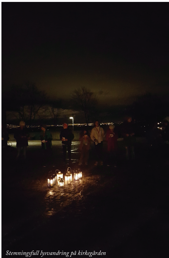
Stemningsfull lysvandring på kirkegården

Les mer om kirkens mange aktiviteter på vår hjemmeside: www.ostenstadkirke.no . I denne spalten vil vi presentere én aktivitet hver gang. Denne gangen presenterer vi: