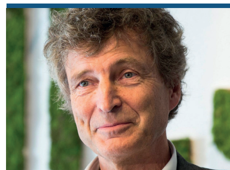
Tirsdag 28. april: På vei mot supermennesket 2.0 Foredrag ved forfatter Dag Hareide Holmen kirke kl. 1930