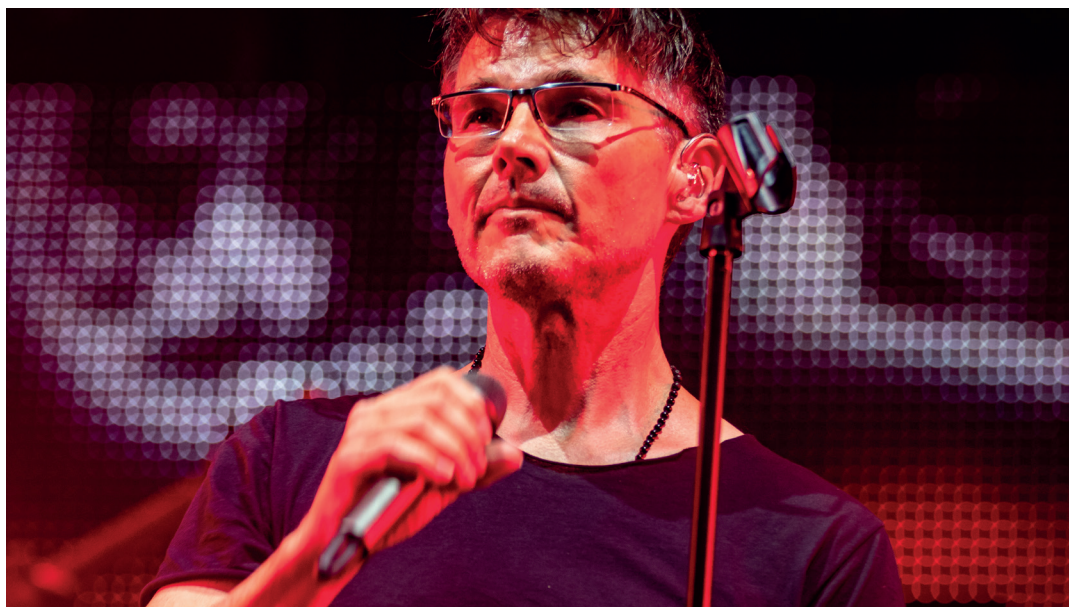
Morten Harket på Kongsberg Jazzfestival i 2018.

«Jeg henvender meg ikke i form av direkte bønn eller meditasjon, men samtidig er livsanskuelsen en integrert del av hvem jeg er», svarer Harket.