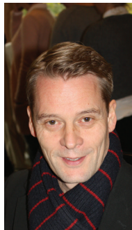
Lederskifte i Asker-kirken side 7