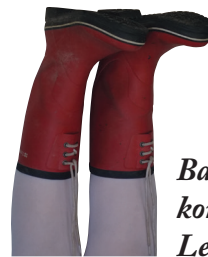
Babyteater kommer! Les mer side 8