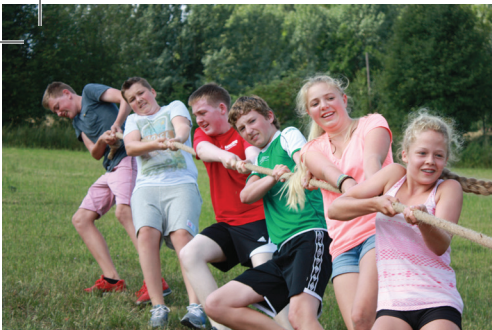
Alle årets konfirmanter side 10