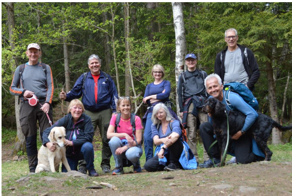
Østenstad mannlige turlag – denne gangen også med kvinner.