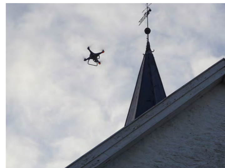
Slik ser det ut når droner inspiserer kirketaket.

I utallige generasjoner har kirken vært helligsted ved de store begivenhetene i livet: dåp, konfirmasjon, vielse og begravelse. Hurum kirke er derfor et viktig identitetsmerke for alle som bor i Hurum. Nå er det felles kulturarv for alle Askerbøinger.