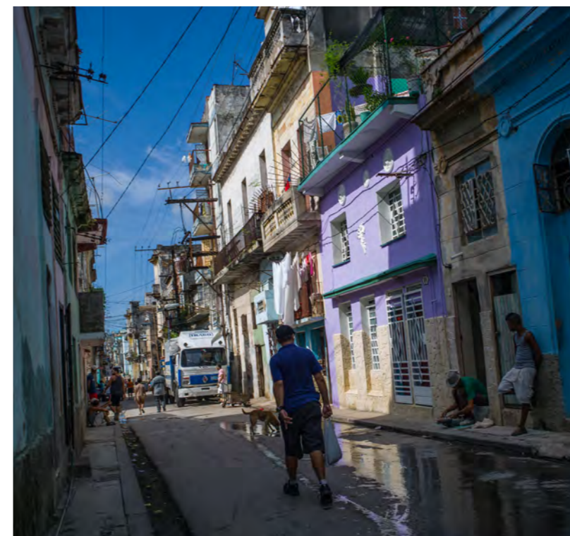
Handelsboikott og koronapandemien har vært beinhardt på cubansk økonomi og brorparten av innbyggerne mangler det aller meste - som matvarer, bensin og såpe.

Gaver kan gis på Vipps 72037 (Nordre Hurum sokn) og Vipps 626276 (Søndre Hurum sokn). Gaver til Bibelselskapet kan også gis direkte på konto: 3000.16.16869 merket «Bibeldagen 2021»