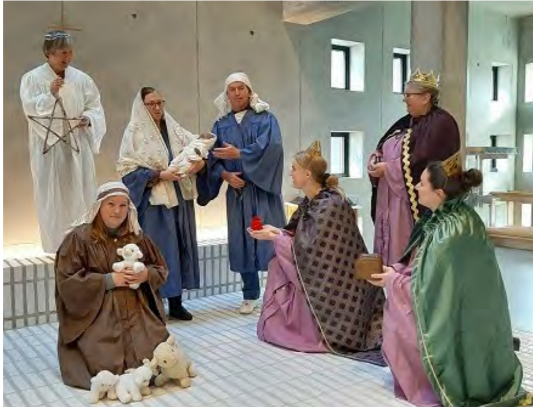
Krybbevandring - på bildet ser dere stabens kostymeprøve, vi gleder oss!

Vandringen avsluttes rundt barnet i krybben, hvor alle vi har møtt på reisen har kommet frem, og vi synger «Et barn er født i Betlehem».