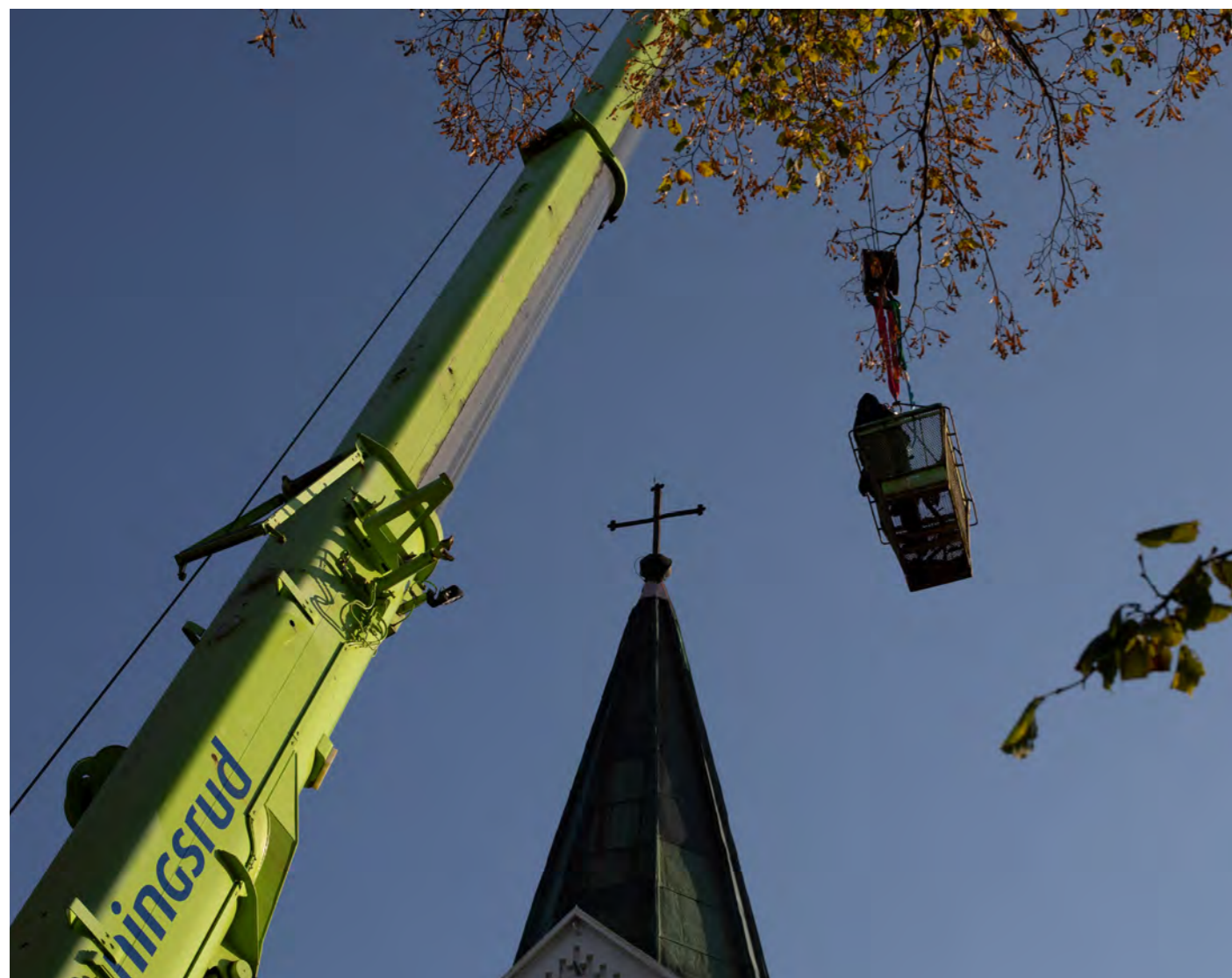
Stor kraner måtte til da kobberplater måtte skiftes ut øverst på kirketårnet i Hurum kirke