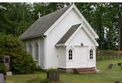
Gravkapellet ved Holmsbu kirke.