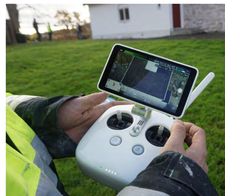
Mens man tidligere måtte opp med store stillas og stiger kan man nå stå på bakken og inspiserer kirketakene fra en skjerm. En revolusjon som sparer både tid og penger!

Fra i år skal derfor alle kirkelige bygg i Asker skal ha et årlig, planlagt, utvendig tilsyn av byggets «værhud». Haandverkerne AS skal rette enkle feil, slik som å rette takstein og , rense takrenner o.l. og rapporterer til fellesrådet eventuelle behov for mer omfattende tiltak. Riksantikvaren dekker kostnad for avtalen, foreløpig for 2 år. Fellesrådet leder prosjektet, og må dekke kostnadene ved eventuelle tilleggsarbeider.