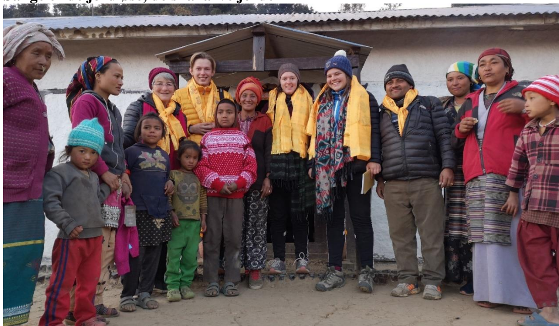
Gå Ut Senter - elever ble velsignet på de jordløses jord og i deres hus.

Fra 4 000 meters høyde reiste vi ned i andre høydepunkt, på besøk til de siste husene som ble bygget ferdig i juli. Vi fikk møte fire familier. Alle hadde samlet seg på tunet der to brødre har fått hus. Alle menn var ute på arbeid, mens kvinnene som arbeidet i nærområdet, møtte oss. De hadde vært jordløse i minst tre generasjoner. Å bli tatt inn i deres historier og deres gleder over hvordan livets vending og håp, berører oss og er til stor lærdom for oss. Det var historiefortellere fra Gå ut Sentret, så kanskje får dere lese historiene deres senere?