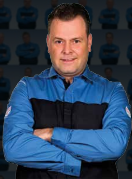
Rune Austrheim Fosnøy Bilsenter AS

Til sammen har vi 3 815 års erfaring med bilservice i Norge.