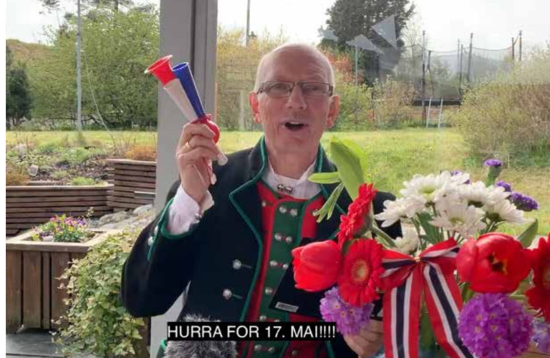
Her er bilde frå helsinga på 17.mai

Takk for all din fødsels glede, takk for ditt det guddomsord Takk for dåpens hellig væte, takk for nåden på ditt bord! Takk for dødens bitre ve, takk for din oppstandelse, takk for himlen du har inne, der skal jeg deg se og finne.