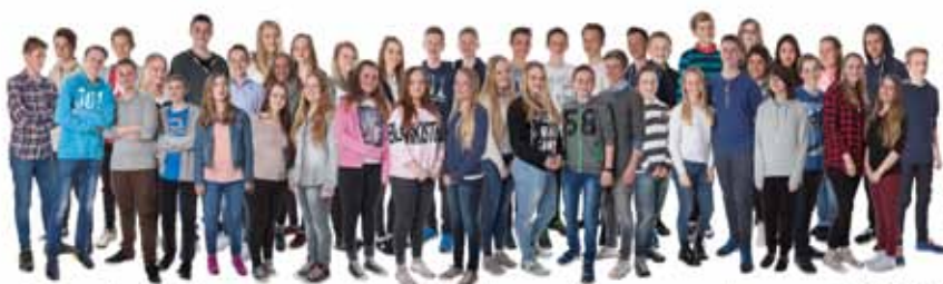
Austrheim og Fedje konfirmantane 2015