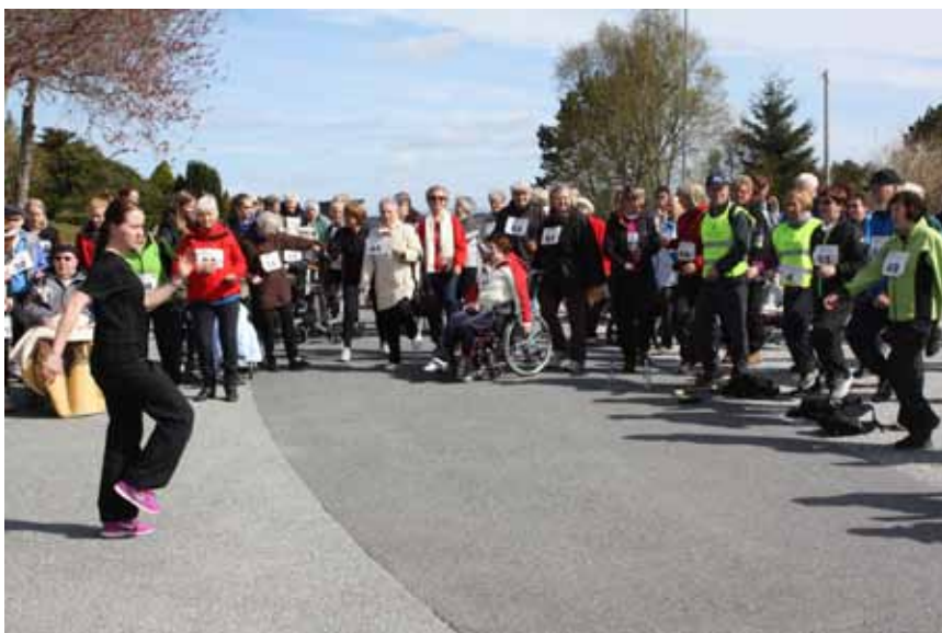
Her eit glimt frå Verdas aktivitetsdag eit tidlegare år.

Arrangøren håpar på godt vær og ikkje minst godt oppmøte