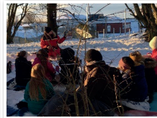
4. klasse – Kaland barne- og ungdomsskule