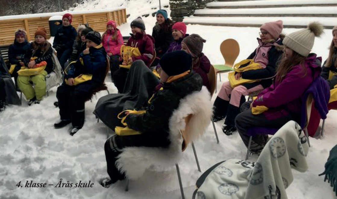
4. klasse – Årås skule