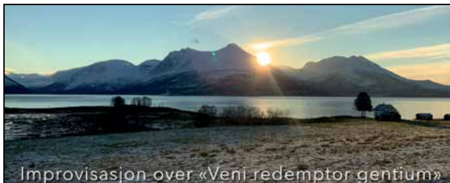
Improvisasjon over «Veni redemptor gentium»