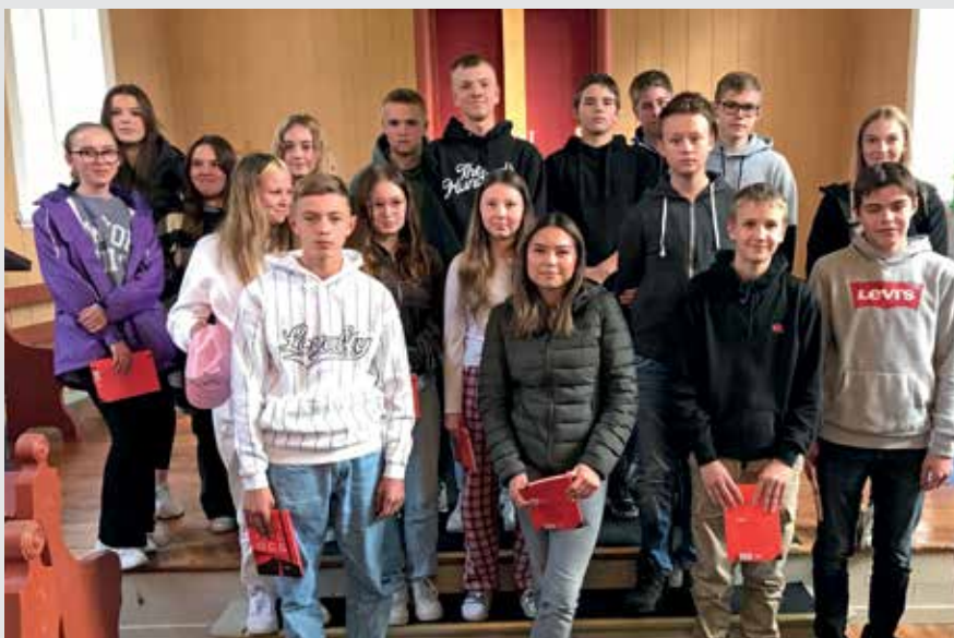
Konfirmanter i Balsfjord kirke.

Vi gleder oss over de mange unge som i høst startet på konfirmasjonsundervisningen og ønsker dem ei fin konfirmasjonstid.