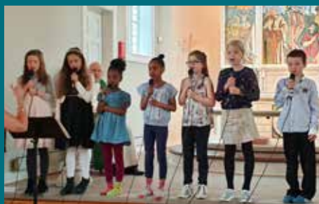
Bli med i Ytre Arna Barnevokal! Side 3

Opningstidene i Noa open barnehage (Ytre Arna sokn) og Sakkeus open barnehage (Arna sokn) er korona-reduuerte, men barnehagane har framleis tilbod. Sistnemnde kan by på heilt ny leikeklass (biletet). Side 2-3.