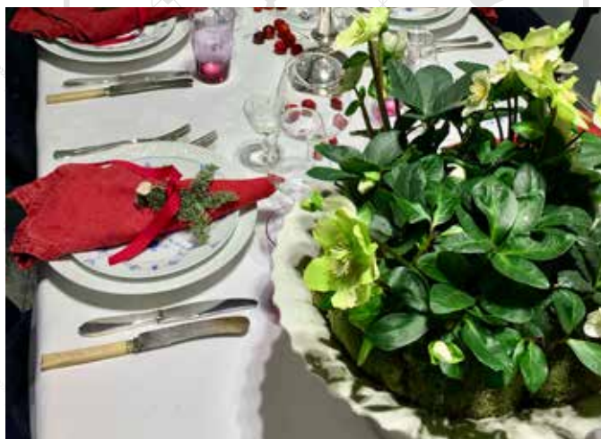
JULEROSE BRUKT TIL BORDDEKNING: Det er nydelig å se julerose i krukke, gjerne med mose som skjuler pottekanten.

Den blomstrer langt utover våren, men etter hvert kommer det brune flekker på bladene og noen av blomstene. Klipp da av bladene helt nede ved roten. Da vil soppen – som du ser i det brune på bladene – ikke spre seg til blomsten. Bladene vil