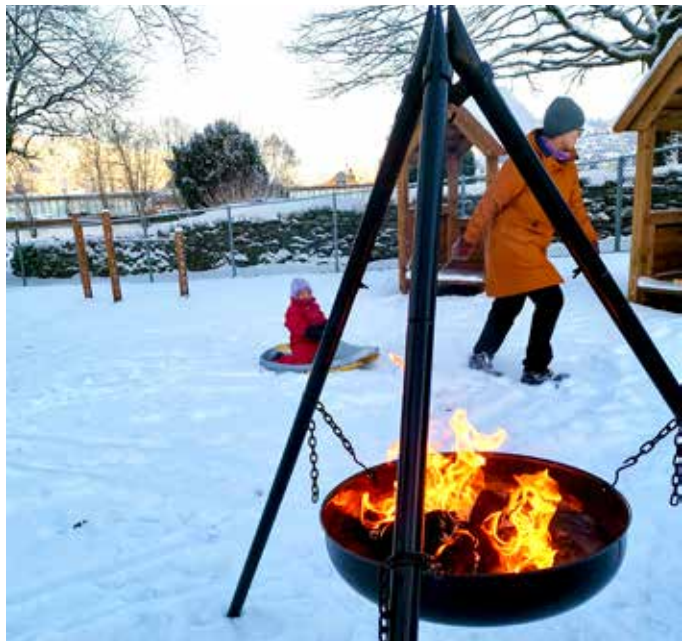
Vinterleik i barnehagen