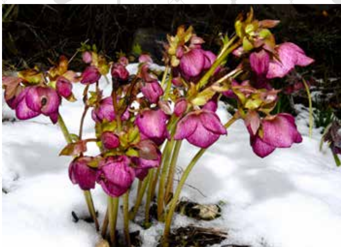
«ANNA'S RED» I HVIT SNØ: Nesten uvirkelig med så store vakre blomster i snølandskap. De klarer seg bra, om det er godt drenert og ikke surt jordsmonn.

Carol, som har pent blågrønt bladverk og kompakt vekst. Kremhvite blomster på rødlige blomsterstengler. Etter hvert som blomstene eldes får de et vakkert rosa fargeskjær. En av flere gode sorter i serien Gold Collection.