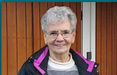
Leiar for K-Forum i 30 år Side 18-19