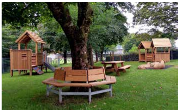
Heilt ny leikeplass