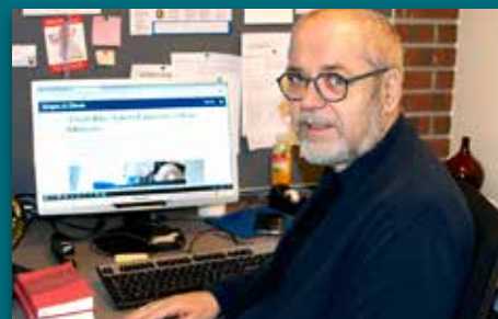
Frykt ikkje! Side 6-7