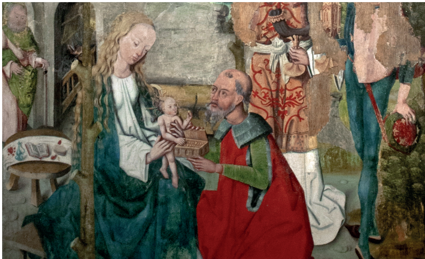
Utsnitt av alterskapet i Mariakirken i Bergen.

Nå vandrer fra hver en verdenskrok I ånden frem, i ånden frem Et uoverskuelig pilgrimstog mot Betlehem, mot Betlehem.