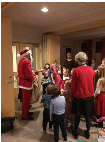
Mange gjør en innsats for å lage god juletreffest!

Har du tenkt på at det kunne vært fint å være med på noe positivt sammen med andre?