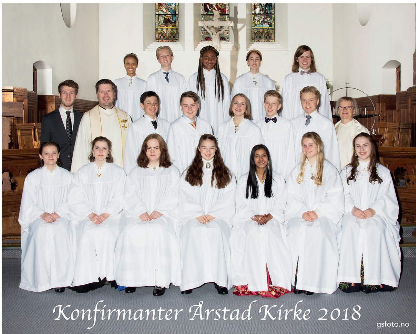
Konfirmanter Årstad Kirke 2018