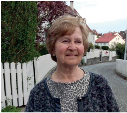
Av Karin Fauske

Fra jeg var liten har jeg likt å synge, og jeg synger fremdeles selv om røsten ikke er like klar. I ungdommen var det sangen: