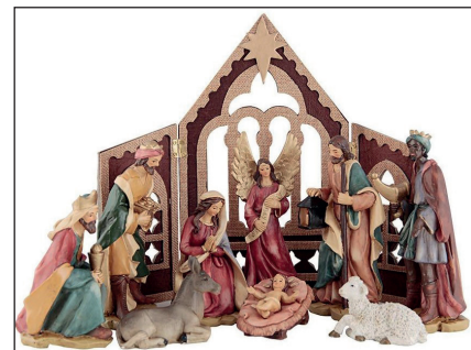
Blant mange gevinster; Dukke med klær og vogn. Julekrybbe fra Hadeland