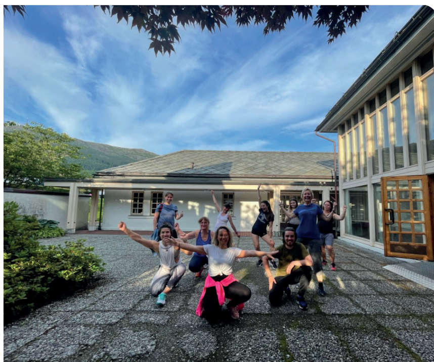
Etter en zumba-time

Denne sommer har Fridalen og Årstad menigheter hatt et variert tilbud av aktiviteter i ferien. Sommer aktivitetene har blitt en god tradisjon i begge menighetene og det er stadig flere som deltar.