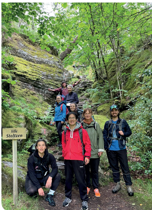
På vei til Årstahiti