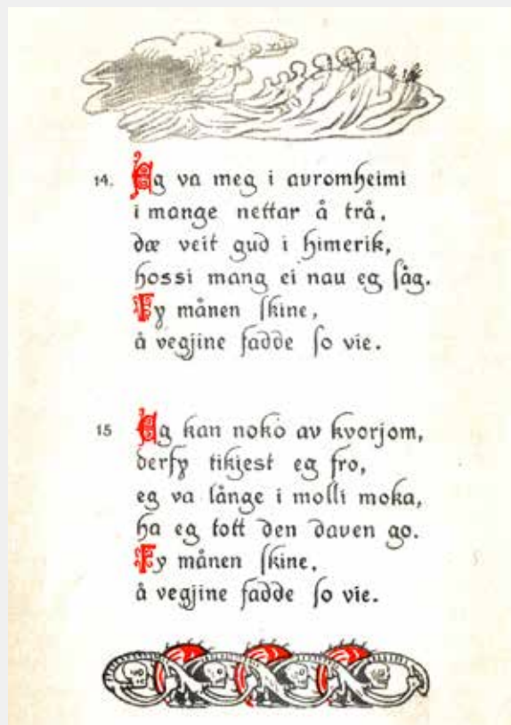
«FOR MÅNEN SKIN'E, Å VEGJINE FADDE SO VIE»: Kunstnaren Gerhard Munthe (1849-1929) er kjend både for sine særmerkte teikningar til Snorres kongesoger og for den handteikna utgåva av Draumkvedet frå 1904; her vers 14 og 15 frå innleiinga til visjonsdiktet.