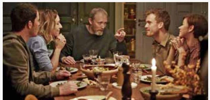
DANSK TV-SUKSESS: Tv-serien Herrens veier har fått 700.000 dansker til å benke seg foran tv-skjermen hver uke.

Mer informasjon: folkekirken.dk/aktuelt/herrens-veje