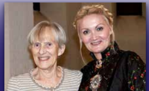
Draumkvedet for 20. gang Side 5-7