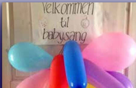
Syng med babyen Side 19