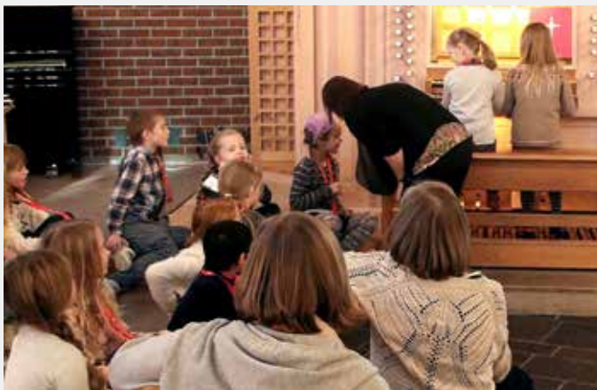
UTFORSKET KIRKEN: Tårnagentene syntes det var spesielt spennende å utforske orgelet.

Også denne gangen bidro foreldrene med massevis av kaker og boller til kirkekaffen. Her ventet for øvrig en overraskelse til alle foreldre, besteforeldre og andre som var med: en