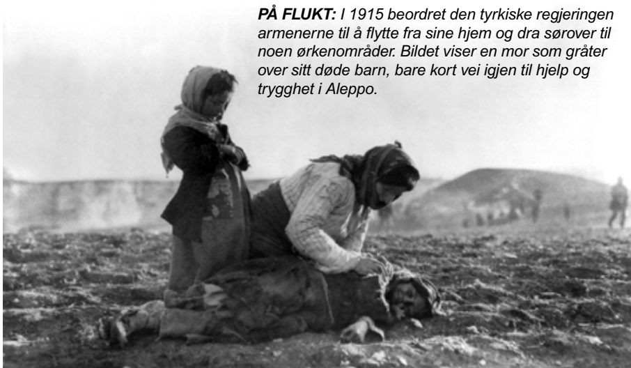
PÅ FLUKT: I 1915 beordret den tyrkiske regjeringen armenerne til å flytte fra sine hjem og dra sørover til noen ørkenområder. Bildet viser en mor som gråter over sitt døde barn, bare kort vei igjen til hjelp og trygghet i Aleppo.

I 1915 beordret den tyrkiske regjeringen armenerne til å flytte fra sine hjem og dra sørover til noen ørkenområder. Avgjørelsen var ment som en kollektiv straff for kontakten den tyrkiske regjeringen hevdet at armenerne hadde hatt med Russland – på det tidspunktet Tyrkias fiende. Tvangsforflyttingen ble åsted for store massakre. Hele byer ble nærmest utslettet. Først ble voksne menn og eldre gutter skilt ut og skutt. Kvinner, barn og eldre menn ble sendt ut på en lang vandring sørover. Her ble mange utsatt for angrep og overgrep. Barn ble bortført. Det er blitt anslått at