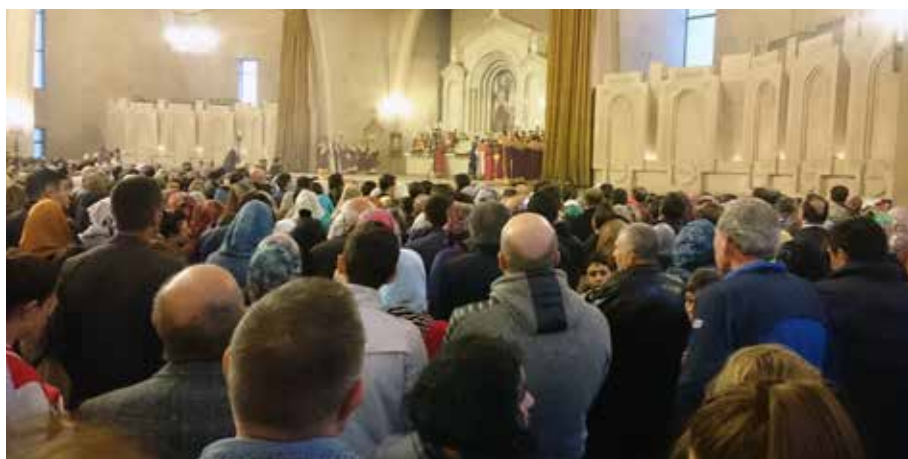
PÅSKEAFTENGUDSTJENESTE I JEREVAN: Det å få være med på en påskeaften-gudstjeneste i Jerevans største katedral sammen med flere tusen armener, var noe av det sterkeste vi opplevde. Da får du virkelig følelsen av å være en del av den verdensvide kirke.

Georgia var sammen med Armenia et av de første landene som erklærte seg som kristent. Det skjedde i det fjerde