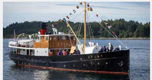
FOLKEFEST MED VETERANBÅTAR: MS Atløy, som her siglar inn på havna i Florø under Fjordsteam 2015, kjem til Bergen under Kystsogevekene.

For dei som vil vere med på ein av båtane, vil det kome informasjon om kor ein får kjøpt billett. Følg med på www.kystsogevekene.no .