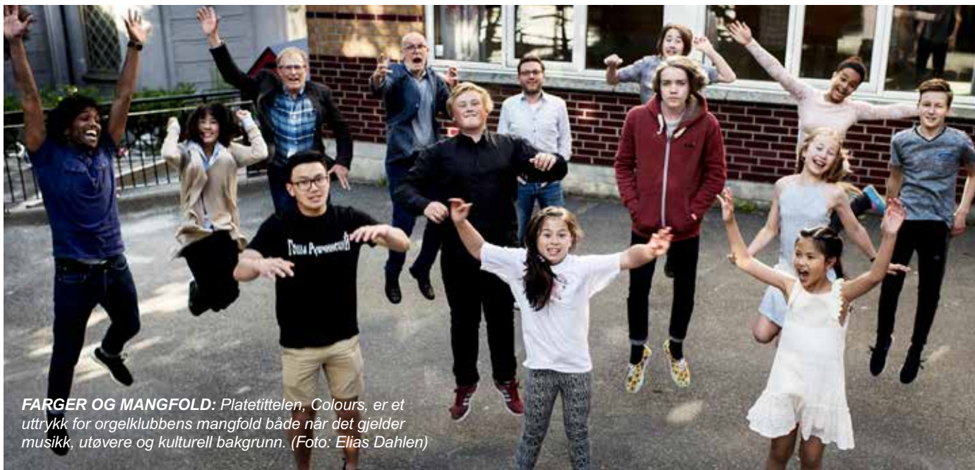
FARGER OG MANGFOLD: Platetittelen, Colours, er et uttrykk for orgelklubbens mangfold både når det gjelder musikk, utøvere og kulturell bakgrunn.

Klubben består av 25 elever og fire lærere. Elevene engasjeres med jevne mellomrom til å spille i messer, gudstjenester og konserter.