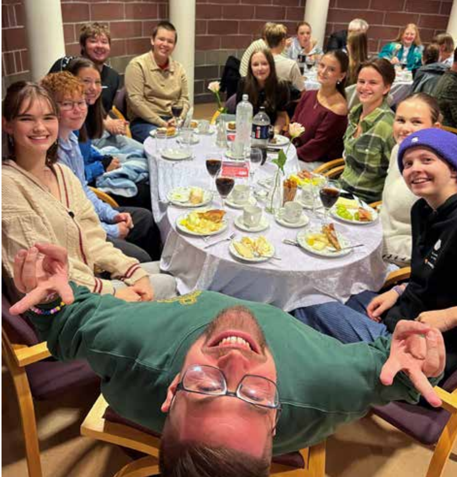
Her er et knippe av kjekke og humørfylte ungdomsledere som er med og skaper stemning på ulike tilstelninger og interessegrupper gjennom konfirmant-året

I kirken har vi vår egen trosopplæringsplan/undervisningsplan for hvert kull fra 0-18 år. Alle døpte i vår menighet får tilbud om opplæring tilpasset alder, minst én gang i året. Inne i denne planen finner vi konfirmasjonstiden.