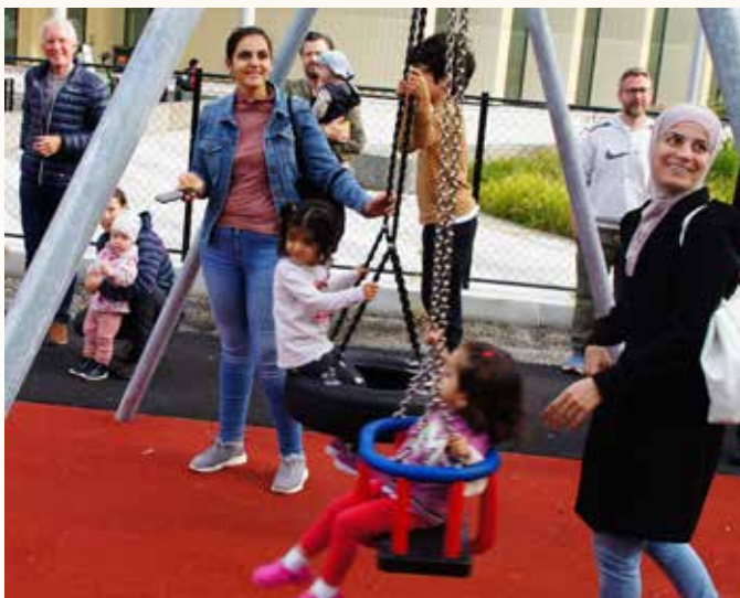
En vakker mandag i september ble kirkelekeplassen åpnet til glede for store og små.