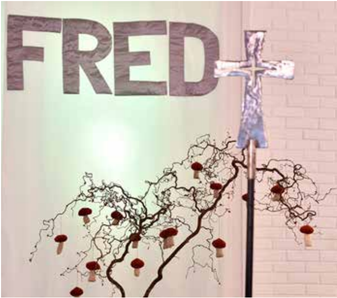
Utsnitt av «alterveggen» til Haukås nærkirke. Denne er inspirert av den apostoliske hilsen «Nåde være med dere, og fred fra Gud, vår Far, og Herren Jesus Kristus.»

I fjor var det ny rekord for innmeldingar i Den norske kyrkja. Mange av dei som melder seg inn er unge. Lenge har det vore litt kult å gå sine eigne vegar og melde seg ut av kyrkja. Har det blitt trendy å gå sine eigne vegar og melde seg inn i kyrkja?