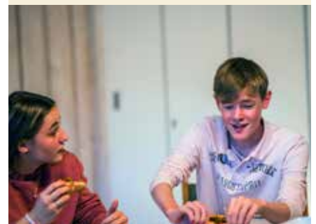
Stemming fra «Pit Stop/Ungdoms-klubb i kirken»

Her blir det god mat, konkurranser og mye sosialt. Velkommen!