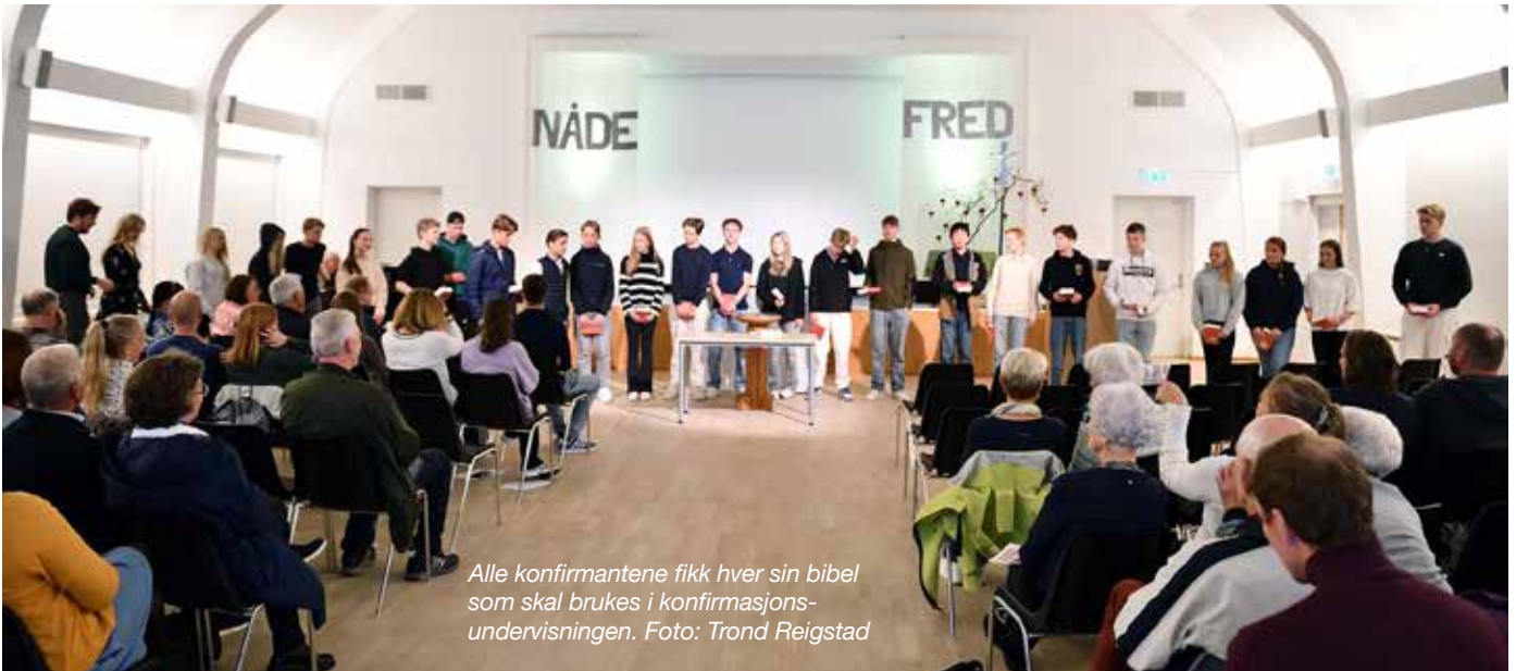
Alle konfirmanterne fikk hver sin bibel som skal brukes i konfirmasjonsundervisningen.

mer enn 25000 mennesker på gudstjeneste. Mellom tre og fire hundre ungdommer er konfirmert i regi av nærkirken, og ca. hundre av dem har vært med på lederkurs etter konfirmasjonen. På en gudstjeneste er det vanligvis mellom åtti og hundre mennesker som deltar. Nå etter korona-tiden er det også kommet i gang fem hus-fellesskap (små-grupper) hvor mennesker kommer sammen og deler liv og tro.