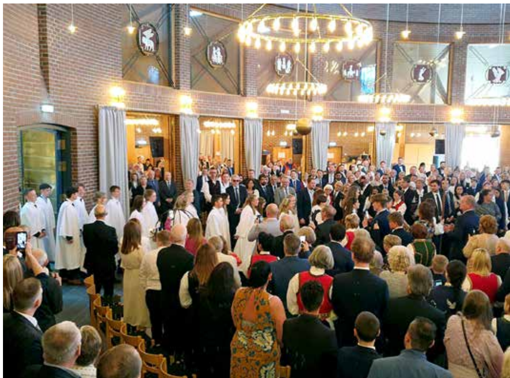
På store festdager, slik som konfirmasjon, er kirken sprengfull av besøkende

Tor Vilhelm Tysseland Kirketjener i Åsane