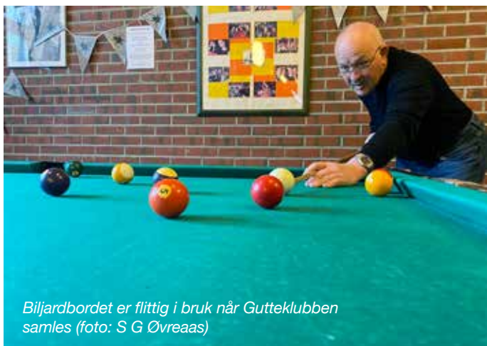
Biljardbordet er flittig i bruk når Gutteklubben samles