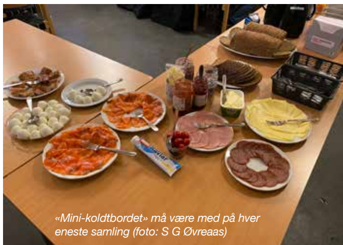
«Mini-koldtbordet» må være med på hver eneste samling