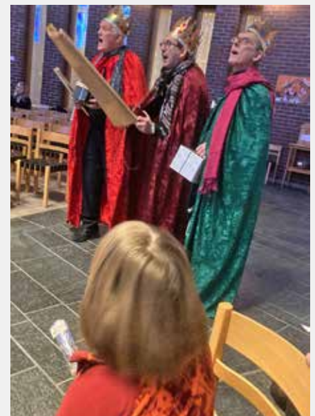
Tre ordentlige vismenn dukket opp i kirken til stor begeistring for alle

sansene Gud har gitt oss, og håper det blir et uhytidelig og godt møte mellom barn, kirke og Guds kjærlighet.