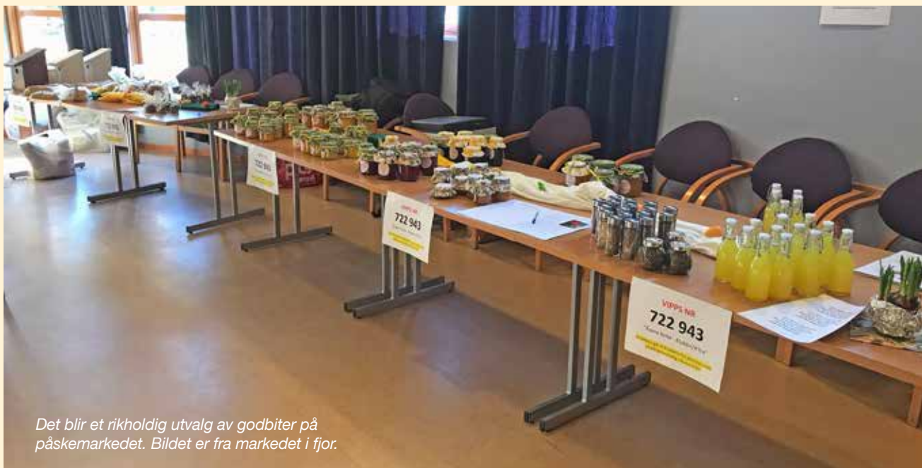
Det blir et rikholdig utvalg av godbiter på påskemarkedet. Bildet er fra markedet i fjor.

Festen er en «pakkeløsning» hvor du får anledning til å delta i en nydelig musikk gudstjeneste kl 12.30 med påskevandring rundt påsketeppet og hvor Rolf prest leder oss gjennom hele den dramatiske påskeuken. Korister fra Cantus Sororum står for det musikalske løft.