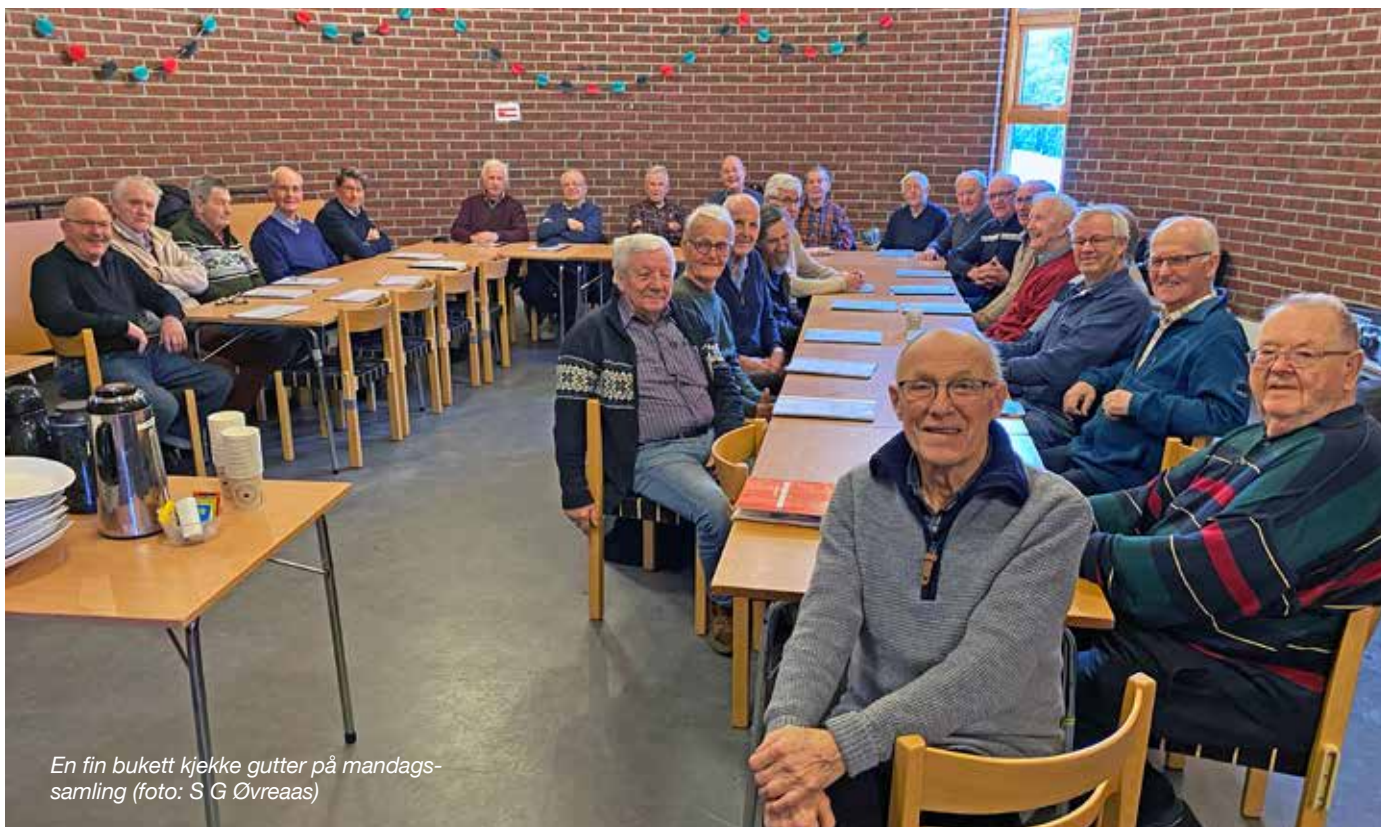
En fin bukett kjekke gutter på mandags-samling