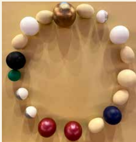
Kristuskransen med alle perlene er et godt pedagogisk hjelpemiddel i konfirmasjonsundervisningen

Troen kan av og til være litt vanskelig å “få tak på”. Kristuskransen (armbånd) er derimot ganske lett å få tak på. Den passer både i hånden og som armbånd du kan ha på deg. Med Kristuskransens