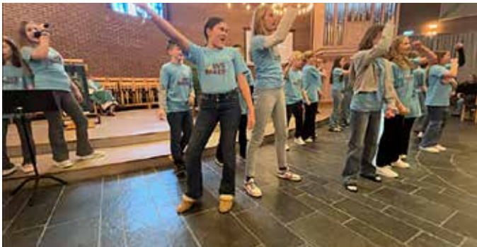
Ivrige dansere på Lys våken i januar.

Sansesamling , Lørdag 27. april hadde vi sansesamling for ettåringar. Her lekte vi og utforsket både sanser og kirkerom.