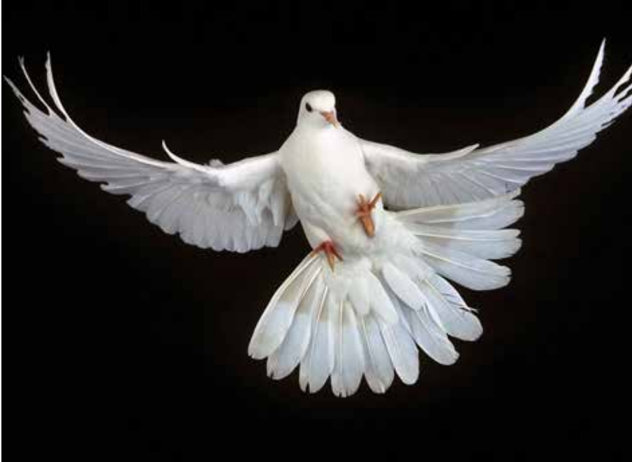
Den hellige ånd symboliseres ofte med en due.

Hvem var mennesket Jesus? Det er det egentlig enkelt å gi et svar på. Han var en mann som levde for omkring 2000 år siden. En som sørget for uro, men som raskt ble populær. Fortellingen om Jesus kan fortelle oss om slekten hans, om hvor han ble født og hvor han levde og virket. Dette kan vi tro på er sant fordi det er så konkret. Men når Jesus sier om seg selv at han og Faderen er ett, at den som har sett han har sett Faderen (Joh. 14, 8), da begynner det å bli mer innviklet. Når han bryter naturlovene ved å gå på vannet, gjøre vann