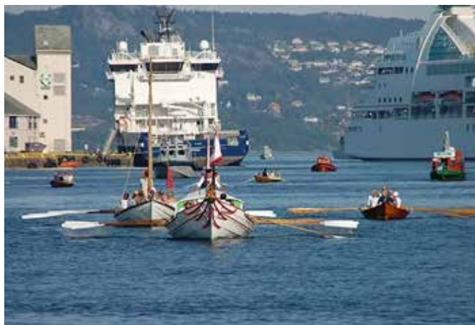
Verdiseilasen tar med seg verdibrev fra unge langs Vestlandskysten.

Les mer om verdiåret 2024 på bispedømmet sin nettside http://kyrkja.no/bjorgvin/2024