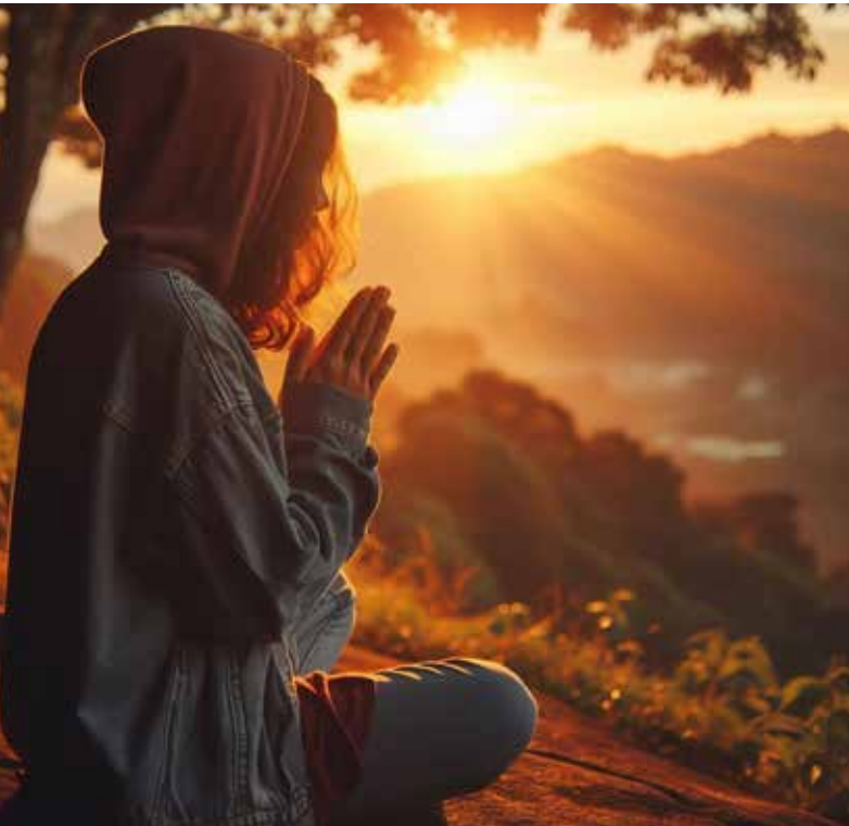
Bare i håp til Gud er mitt hjerte stille. (Salme 62,2).