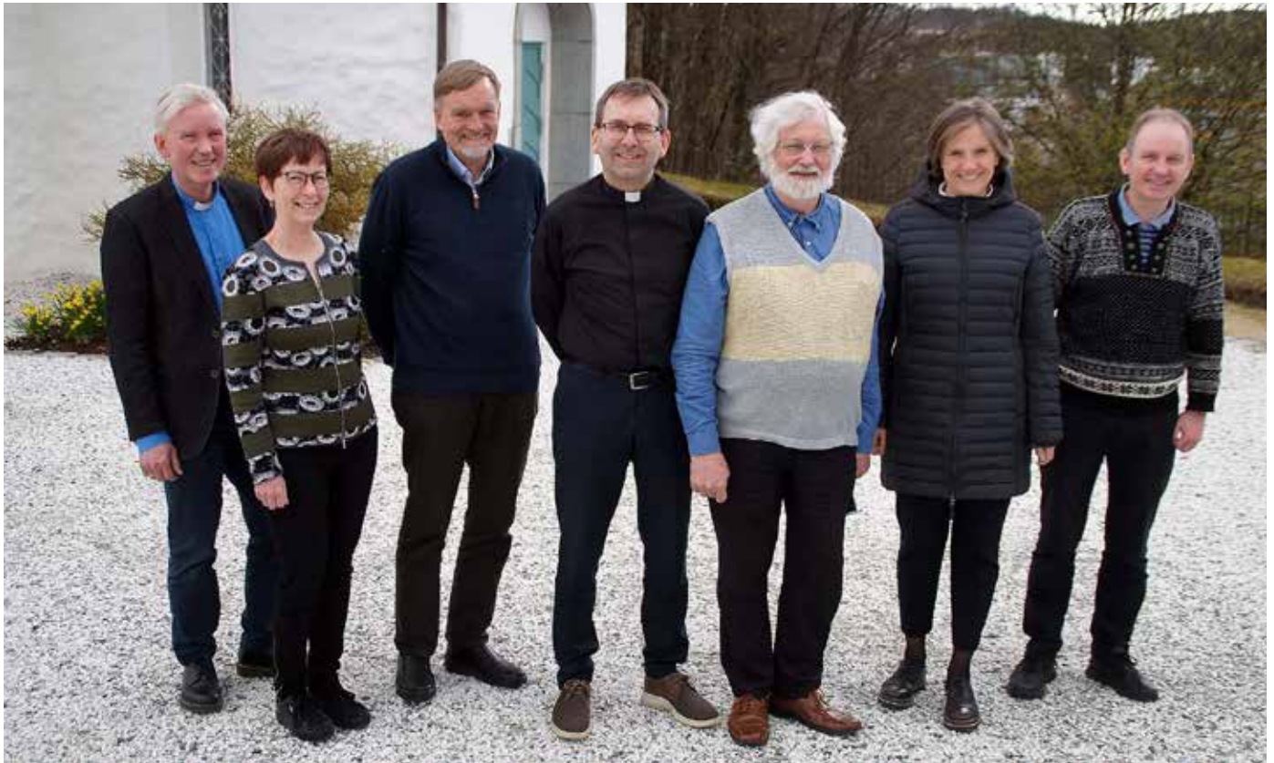
Representanter fra stab og menighetsråd i Åsane menighet sammen med barne- og familieminister Kjersti Toppe på kirkebakken på Saurås.

Tidligere i år lanserte barne- og familieminister Kjersti Toppe, som også har ansvaret for regjeringens tros- og livssynspolitikk, en omfattende ny bevaringsstrategi for kulturhistorisk verdifulle kirkebygg.