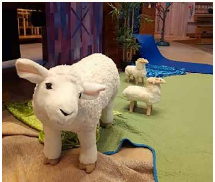
Sauene er alltid klare for besøk. Her under krøllesamling i februar