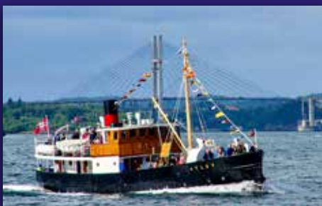
Kirkeferd i veteranbåt Side 5-7