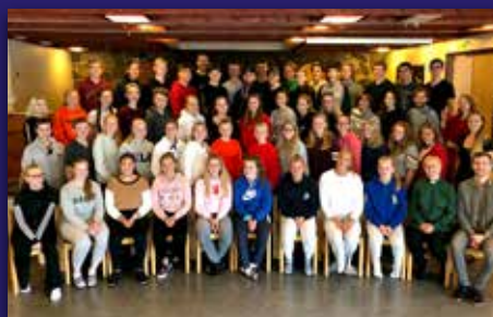
Lederweekend på Dyrkolbotn Side 4