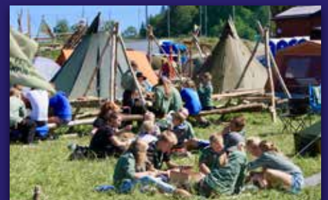
Rollandspeidere på landsleir Side 18