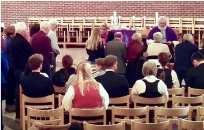
NATTVERD I ÅSANE KIRKE: Det er et flott fellesskap når vi samles rundt nattverdbordet.

Visst er det mye merkelig man gjør i løpet av en gudstjeneste, men dette må være toppen, synes mange. Konfirmantene spør meg: «Hvorfor holder presten opp en pokal med saft og noen kjeks»? Når de får høre at det er vin, blir de enda mer nysgjerrig og lurer på om vi kan bli fulle av den?