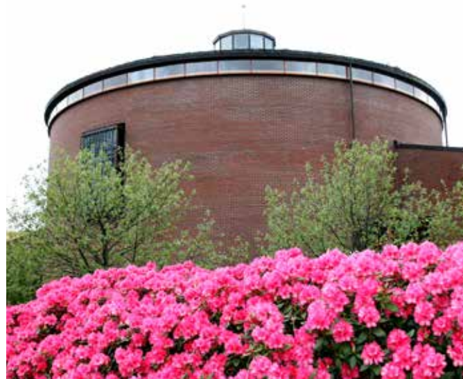
MØTEPLASS I 25 ÅR: I høst runder Åsane kirke et kvart århundre.

Velkommen til kirkejubileum – husk å melde deg på!