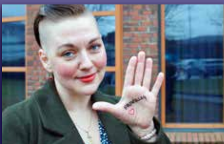
Kirken trenger deg!