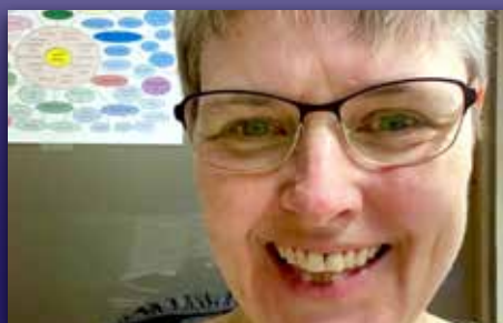
Slutter grunnet nedbemanning