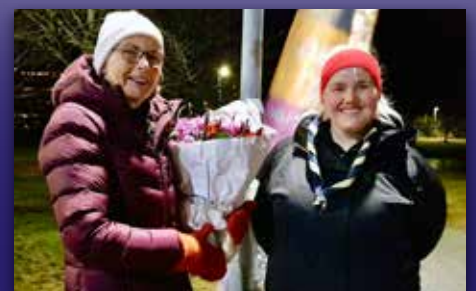
Takk for innsatsen!