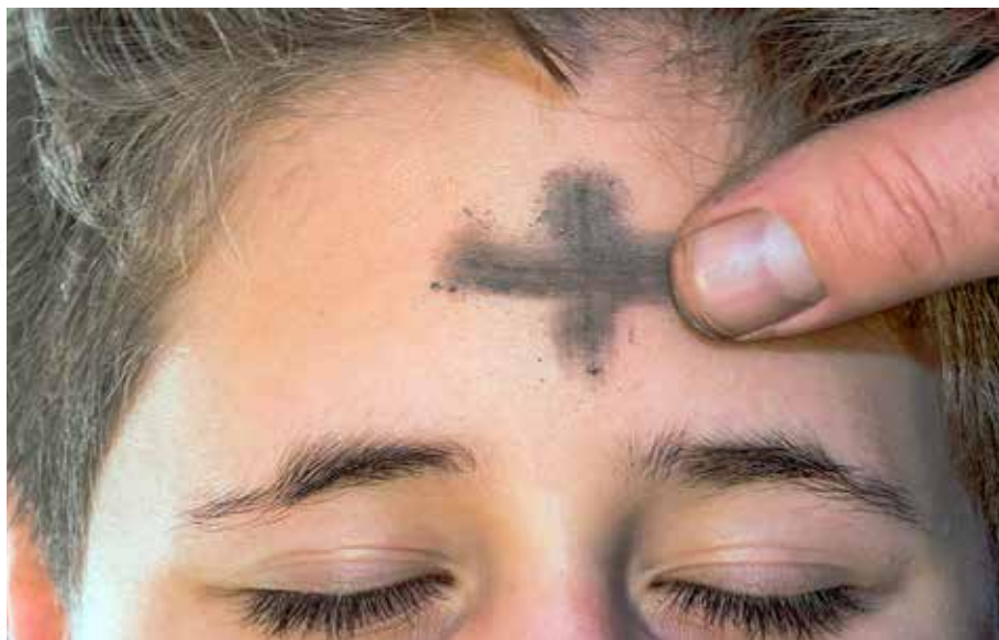
ASKEKORS I PANNEN: Mange kirker har gudstjeneste askeonsdag, ofte med tegning av askekors.

I våre dager er det kanskje ikke så mange som markerer noe faste, det vil si å være avholdende fra god mat og drikke for å være i kontemplasjon og selvransakelse fram mot påske, kirkens store festhøytid når Jesu lidelse, død og oppstandelse blir markert.