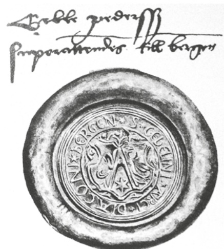
SEGL OG SIGNATUR: Geble Pederssøns segl og navnetrekk, hentet fra et brev fra 1539 - som nå er oppbevart i Riksarkivet.