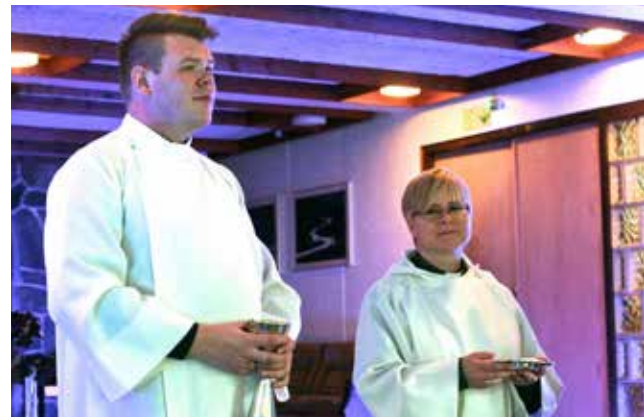
På søndag feiret vi alle gudstjeneste med bønnevandring og nattverd.

Sporløp, underholdningskveld med kampkveld og nattradiosending stod også på programmet på lørdagen. Samarbeid og laginnsats var et nøkkelord. Men det aller viktigste nøkkelordet for weekenden vår var Jesus. På søndag feiret vi alle gudstjeneste med bønnevandring og nattverd. Jesus elsker hvert enkelt menneske uendelig høyt. Vi er uendelig verdifulle hver enkelt av oss. Vi er skapt av Gud til å gjøre godt mot oss selv og godt for hverandre.