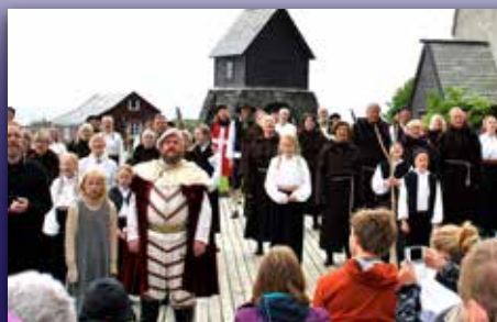
Historiespel i havgapet