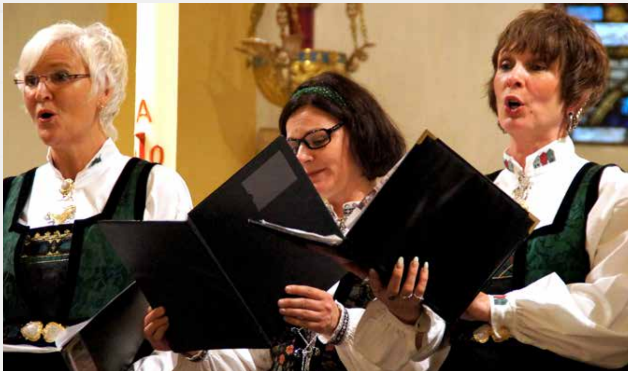
GLEDEN VED Å SYNGE I KOR: Vi har et godt fellesskap, og flere føler at de har fått «venner for livet» her. Bildet er fra en konsert med Cantus Sororum i St. Paul kirke, mai 2014.

Ønsker du at barnet ditt skal utvikle sine musikalske ferdigheter i et godt miljø? Da er et av barnekorene våre riktig plass. Alle har en sangstemme som kan utvikles! Vi har fokus på sangglede og utvikling av stemmen i trygge rammer sammen med andre sangglade barn: