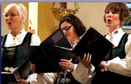
Syng med oss!