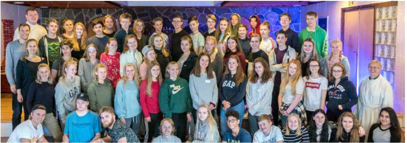
STOR OPPSLUTNING OM LEDERWEEKEND: 61 forventningsfulle ungdommer og unge voksne reiste til Dyrkolbotn Fjellstove på menighetens årlige lederweekend.

I midten av august reiste 61 forventningsfulle ungdommer og unge voksne til Dyrkolbotn Fjellstove på vår årlige lederweekend.