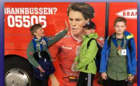
Tok Brannbussen til speider-NM