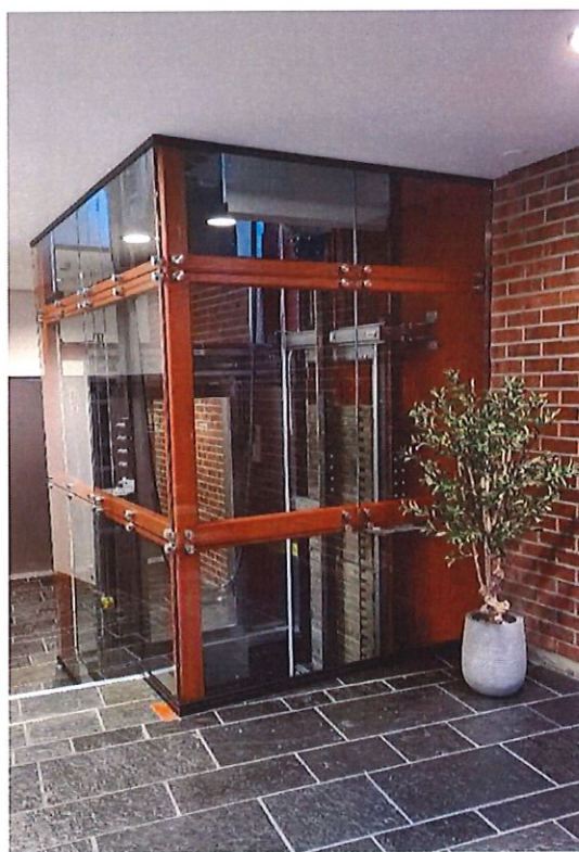
Heisen i underetasjen