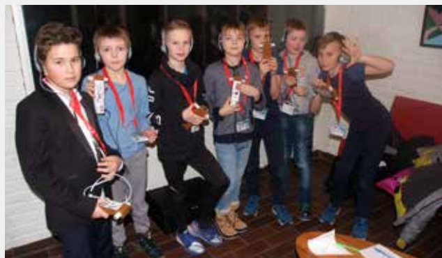
Tårnagenter på oppdrag

Helgen 10.-11. februar inviterte vi 4. trinn til Tårnagenthelg. 16 ivrige agenter meldte seg på, og disse er nå «Agenter av Biskopshavn menighet», spesialagenter i symboljakt, søk etter hemmelige rom og sporsøk med radiopeilere.