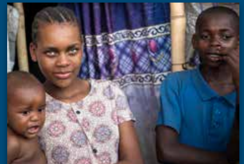
Fasteaksjonen redder liv! Side 12