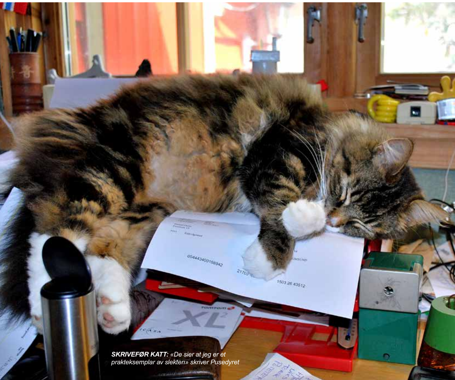
SKRIVEFØR KATT: «De sier at jeg er et prakt eksemp lar av slekten» skriver Pusedyret