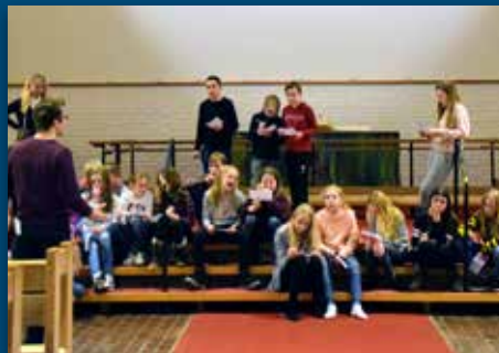
Agenter i kirkerommet Side 17