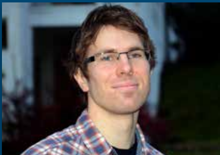
Takk, Johnny! Side 2-3

Ved innsettelsen av glasskunsten i forfjor fungerte Småsalen som et intimt og trivelig kirkerom.