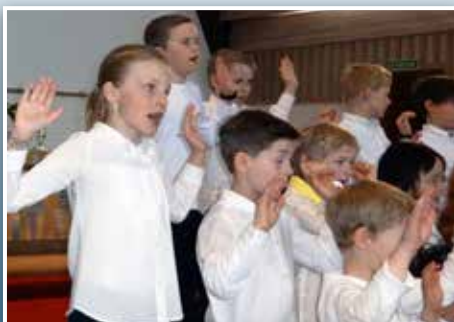
Påskesang i kirken

Se liste over alle våre vakre mai-konfirmanter Side 3