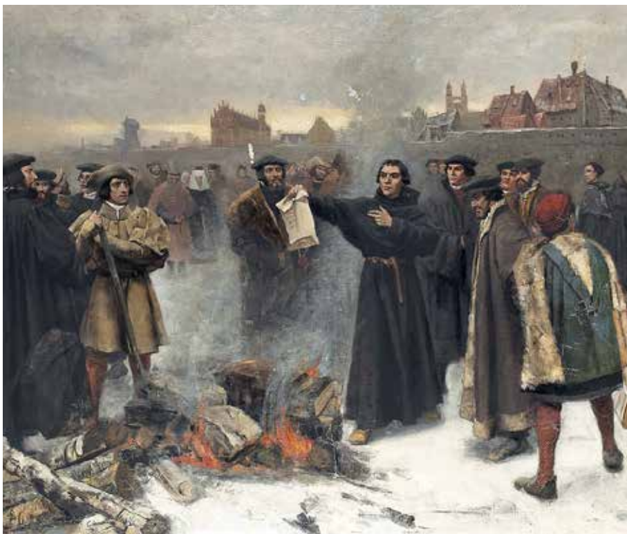
STOD OPP MOT PAVEMAKTA: Den 15. juni 1520 kom pavebullen Exurge Domine frå pave Leo X, der han fordømte 41 læresetningar frå Martin Luthers skrifter. 10. desember same år brende Luther demonstrativt bullen framom Elsterporten i Wittenberg.

Professorar frå fleire fagfelt freista å svare. Som interessert tilhøyrar sat eg igjen med at svaret på spørsmålet var JA. Arven etter Martin Luther, som vi har i den evangelisk-lutherske kyrkja, har medverka sterkt til det velferds-samfunnet og demokratiet vi har i dag. Her ligg vi langt framom katolske land og land som er dominerte av andre religionar.