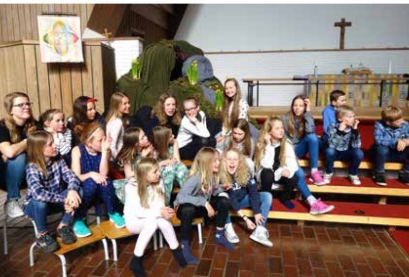
PÅKESANG I KIRKEN: Alle korene var med, fra de minste i Aspirantkoret til Biskant.

Søndag 23. april var det påskefestgudstjeneste i Biskopshavn kirke. Alle korene våre var med, fra de minste i Aspirantkoret til Biskant.