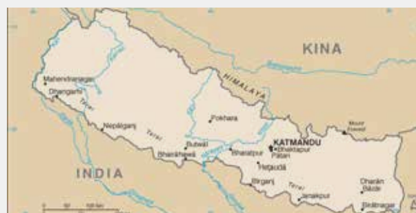
INNEKLEMT FJELLAND: Nepal ligg «inneklemt» mellom India i sør og Tibet i nord.