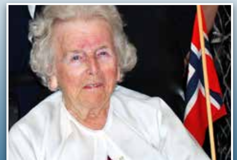
Bursdagsfest med ordfører og prest. Side 17