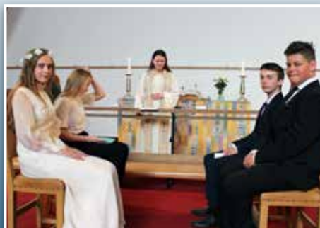
Et ungt «brudepar»