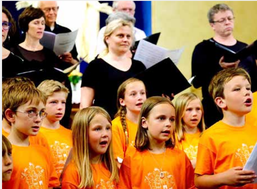
BLI MED PÅ SOMMERKURS: Musica Sacras sommerleir for barn og voksne holdes i år på Sotra/Bildøy bibelskole, og avsluttes med gudstjeneste i Biskopshavn kirke. Bildet ble tatt på Musica Sacra sitt sommerkurs i fjor.

Vi håper mange vil komme til gudstjeneste denne dagen!