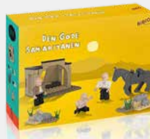
LEK OG LÆR: Byggesettet inneholder brikker, figurer og et hefte som har både bibelteksten, en samtalestarter og byggeinstruksjoner.